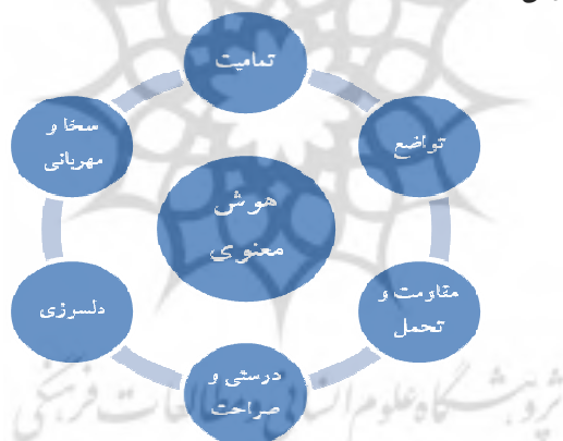
شکل ۱. مولفه‌های هوش معنوی از نظر نوبل و گان

افزایش کارایی و بهره‌وری در آنهاست ولی متأسفانه اغلب در جوامع فناورانه امروزی این مهم به دست فراموشی سپرده می‌شود. این واقعیت در مورد انسان و روابط انسانی وجود دارد که بایستی به انسانها به عنوان موجودات انسانی، نگریده شود نه اشیایی برای رسیدن سازمان به اهداف خود. بنابراین اینکه افراد چگونه با هم یک رابطه خوب در درون سازمان داشته و چگونه با یکدیگر یک اجتماع را خلق کنند، مهم است (زوه‌ر و مارشال، ۲۰۰۴؛ نقل در سیسک ۸ ، ۲۰۰۸). هوش معنوی، به عنوان یک سازه روانی- رفتاری، به افراد یاری می‌رساند تا به ارزیابی موقعیت کاری خود پرداخته و در خود نسبت به خود احساس دلسوزی داشته باشند این موضوع از آن جهت دارای اهمیت است که افراد دارای حس خود دلسوزی نسبت به دیگران نیز می‌توانند دلسوزی نشان دهد (مک‌مولن ۹ ، ۲۰۰۳). افراد حوزه‌های اجتماعی مختلف از جمله کتابداران می‌توانند با رشد مولفه‌های هوش معنوی (شکل شماره ۱) به شغل خود معنا و مفهوم بخشند (نوبل ۱۰ ، ۲۰۰۰).