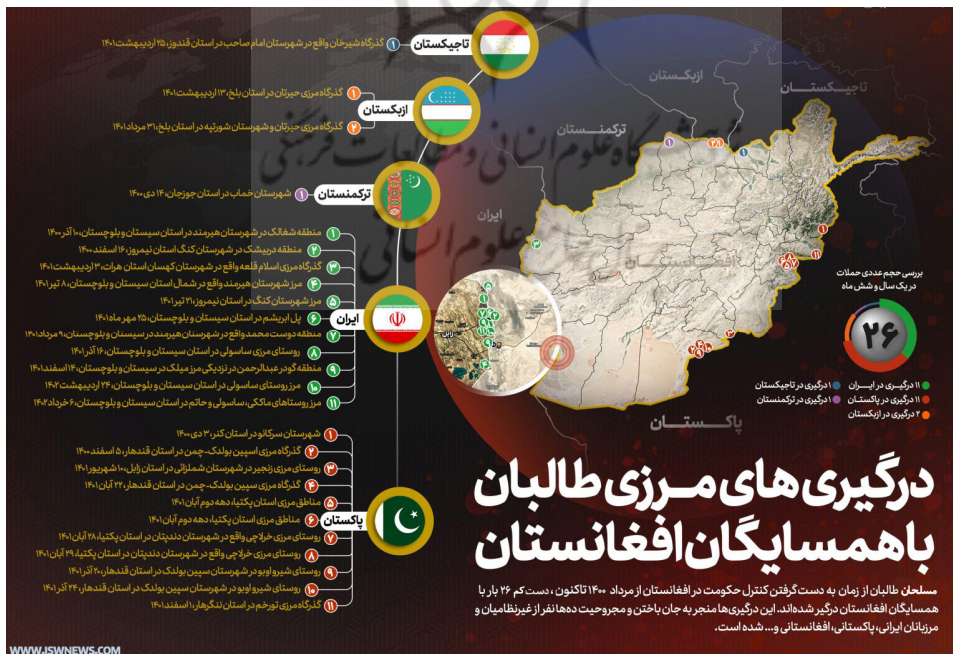
شکل ۱- اینفوگرافی درگیری‌های مرزی طالبان با همسایگان افغانستان

– نامنی‌های مرزی و تعطیلی بازارچه‌های مرزی ۲ : از زمان تسلط نیروهای طالبان بر افغانستان و تحویل پست‌های مرزی این کشور با ۶ کشور همسایه، نیروهای