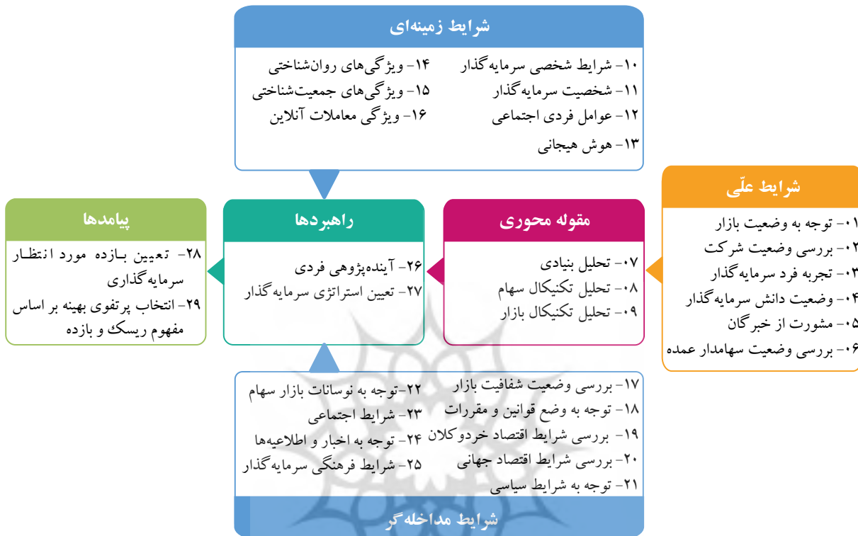
نمودار ۱. مدل نهایی تحقیق

داده‌اند. در مقوله تحلیل تکنیکال سهام و بازار نیز چهار مفهوم شناخت نقطه ورود و خروج، شناخت بازار نزولی، تحلیل روند و تعیین حد ضرر بالاترین تکرار اشاره را از نظر خبرگان به خود اختصاص دادند. در نهایت الگوی پارادایمی ظرفیت ریسک‌پذیری سرمایه‌گذاران در بورس اوراق بهادار تهران با استفاده از روش داده‌بنیاد به صورت نمودار زیر ترسیم شد.