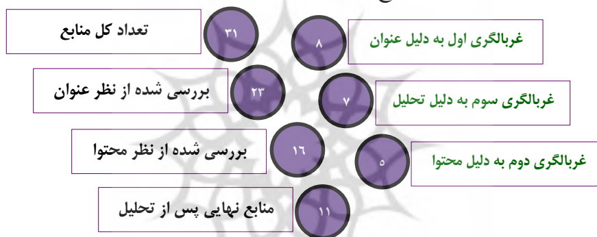
شکل ۳. فرآیند غربالگری اولیه پژوهش‌های مشابه

در بخش اول براساس تحلیل فراترکیب طی بازه زمانی ۲۰۲۲-۲۰۱۸ از نظر میلادی و ۱۴۰۰-۱۳۹۸ از نظر شمسی نسبت به تعیین پژوهش‌های مشابه جهت غربالگری محتوایی اقدام می‌شود تا بتوان محدودیت‌های استفاده از ابزارهای مالی مشتقه تعیین شود. لذا ابتدا می‌بایست براساس مرور پژوهش‌های تجربی مشابه، براساس عنوان؛ محتوا و تحلیل، پژوهش‌هایی مورد بررسی قرار گیرد که بیشترین غرابت را با موضوع پژوهش دارد.