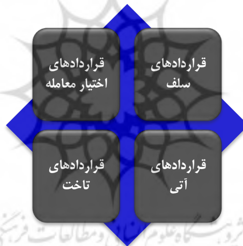
شکل ۱. تفکیک مشتقات مالی

خام؛ طلا؛ ارز؛ سهام؛ شاخص سهام؛ نرخ بهره و حتی یک مشتقه دیگر باشد. به عبارت دیگر، مشتقات در حوزه مالی به قراردادهای مالی اشاره دارد که بازده آنها با تغییر در ارزش سهام؛ اوراق قرضه؛ موجودی کالا؛ ارز؛ نرخ بهره؛ شاخص سهام یا سایر دارایی‌ها مرتبط بوده و یا از آنها ناشی می‌گردد، تغییر می‌کند (اسپرز ۱ ، ۲۰۱۹). در واقع این مشتقات در برگیرنده طیف وسیعی از ابزارها هستند که اگرچه هر کدام از مشتقه‌ها دارای ویژگی خاصی هستند، اما وجه مشترک تمامی آنها براساس قرارداد انتقال ریسک و کسب بازده طی توافق بین طرفین می‌تواند تلقی گردد. به عبارت دیگر طرفین توافق می‌کنند که به محض دریافت هزینه‌ای مشخص، ریسک زیان طرف دیگر را در صورت بروز واقعه‌ای خاص و به ویژه در ارتباط با ارزش دارایی دیگری، بر عهده بگیرد که این دارایی همان دارایی مرجع یا پایه است (پارک و کیم ۲ ، ۲۰۱۵). هرچند توجه به این نکته مهم است که مشتقات می‌توانند بدون نیاز به مالکیت واقعی دارایی پایه منتشر و معامله شوند که وجود همین اشتراک‌ها در این ابزارهای مالی است که امروزه مشتقات بخش مهمی از حوزه مالی و تصمیم‌گیری را به خود اختصاص داده است. در یک دسته‌بندی کلی فارگر و همکاران ۳ (۲۰۱۸) مشابه پژوهش‌های گذشته، مشتقات مالی به عنوان ابزارها اختیار فروش تبعی را به چهار حوزه در قالب چارچوب زیر تفکیک نمودند: