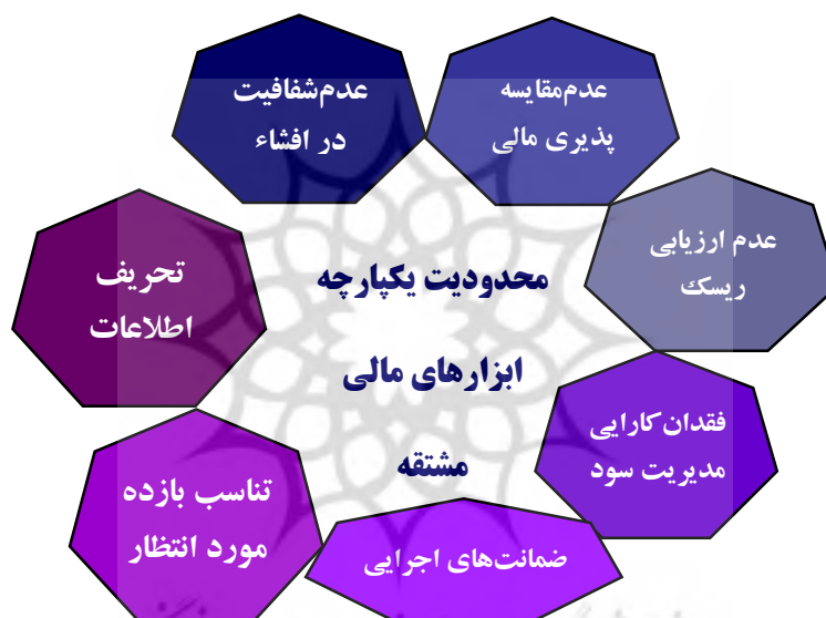
شکل ۳. چارچوب نظری پژوهش

نتایج پس از دو دور تحلیل دلفی نشان داد که تمامی مؤلفه‌های پژوهش براساس ضرب توافقی و میانگین مورد تأیید قرار گرفتند. براین اساس چارچوب نظری پژوهش در قالب شکل ۳ ارائه می‌شود.