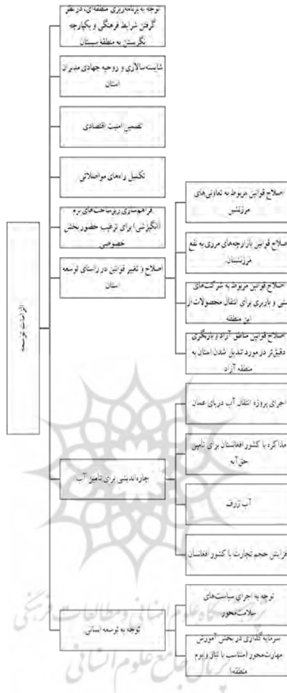
شکل ۳: الزامات توسعه منطقه سیستان