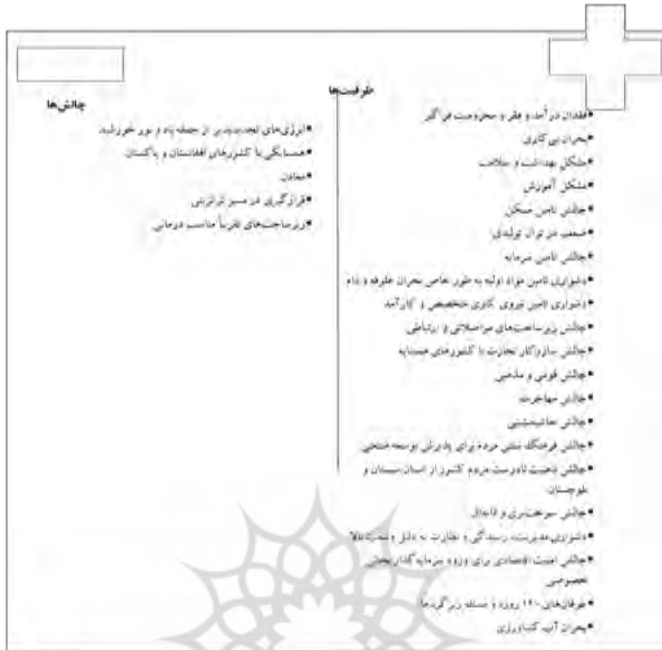
شکل ۲: ظرفیت‌ها و چالش‌های منطقه‌های مرزی سیستان

پژوهشگاه علوم انسانی و مطالعات فرهنگی پرتال جامع علوم انسانی