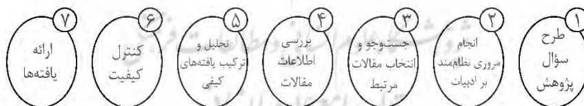
شکل (۱): روش فراترکیب هفت مرحله‌ای سندلوسکی و باروسو (۲۰۰۷)

با توسعه روزافزون تحقیقات در زمینه‌های مختلف علمی، روش‌های متعددی برای ترکیب مطالعات گذشته و بررسی یافته‌های کیفی و طبقه‌بندی آن‌ها در اختیار پژوهشگران قرار گرفته است (شیرمحمدی و همکاران ۱ ، ۲۰۲۰). روش فراترکیب برای ادغام چندین مطالعه برای ایجاد یافته‌های جامع و قابل تفسیر استفاده می‌شود (بک ۲ ، ۲۰۰۲). فراترکیب روشی کیفی برای تولید و تفسیر دانش به‌دست آمده از مرور پژوهش گذشته است. روش فراترکیب راه‌حل مناسبی برای استفاده از نتایج کیفی موجود به‌منظور توسعه نظریه جدید است. این روش ایده‌ها، مفاهیم، روش‌ها و نتایج پژوهش‌های گذشته را بررسی می‌کند (پترسون و همکاران ۳ ، ۲۰۰۱). این روش بر پژوهش‌های کیفی متمرکز است، به عبارت دیگر، تفسیر داده‌های اصلی مطالعات انتخاب شده را ترکیب می‌کند (زیمر ۴ ، ۲۰۰۴). در این پژوهش از روش فراترکیب هفت مرحله‌ای سندلوسکی و باروسو ۵ (۲۰۰۷) استفاده شده است که مراحل آن در شکل ۱ قابل مشاهده است.