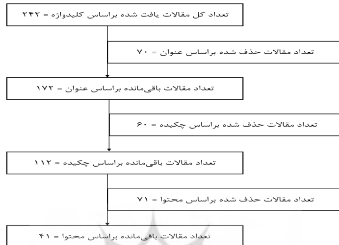
شکل (۲): خلاصه فرآیند انتخاب مقالات مرتبط در روش فراترکیب