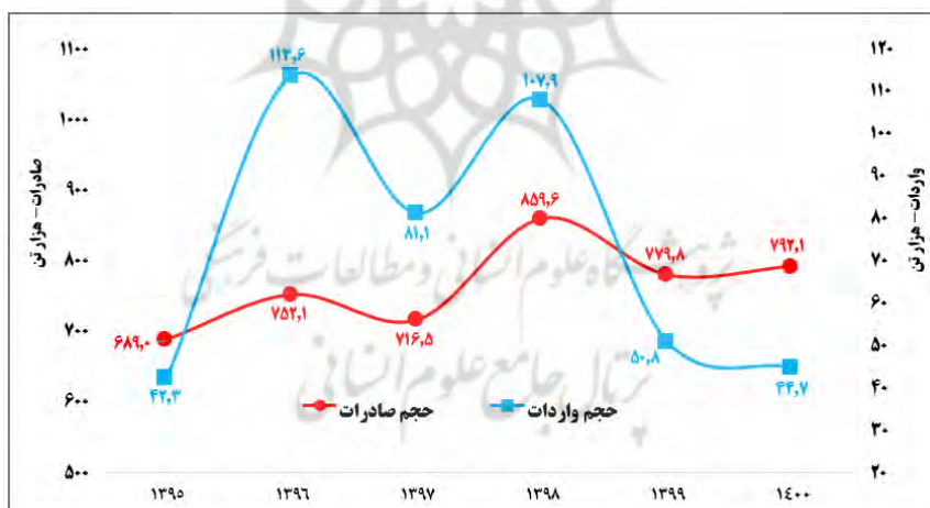
شکل (۱) حجم واردات و صادرات کودهای شیمیایی طی سال‌های ۱۳۹۵-۱۴۰۰