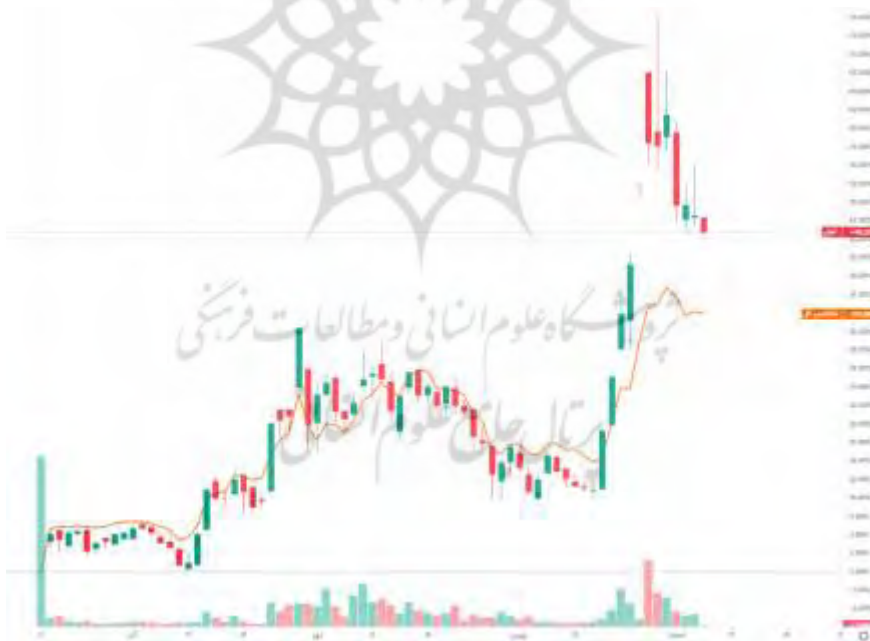
نمودار ۱: مقایسه بازدهی صندوق سهامی اهرمی مفید (توان) با شاخص کل