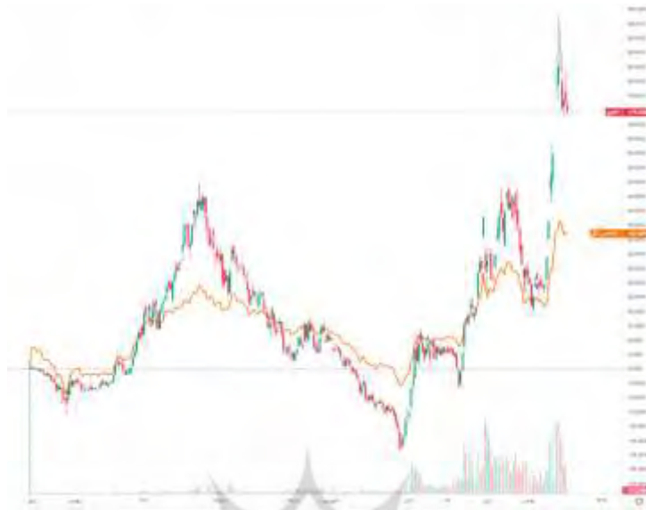
نمودار ۱: مقایسه بازدهی صندوق سهامی اهرمی کاریزما (اهرم) با شاخص کل