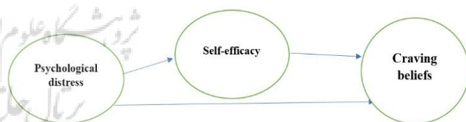
Figure 1. Conceptual model of the research

However, there's a gap in research concerning the relationship between psychological distress, self-efficacy, and craving beliefs among male methamphetamine users, despite their higher usage rates and adverse health impacts (Degenhardt et al., 2020; United Nations Office on Drugs and Crime, 2021). Understanding these aspects could enhance interventions aimed at reducing methamphetamine usage and its associated risks. This study aims to explore the correlation between psychological distress, self-efficacy, and craving beliefs, with a specific focus on understanding the mediating role of self-efficacy. The study's findings will inform targeted interventions to alleviate methamphetamine usage and related health concerns among men. Please refer to Figure 1 for the conceptual model employed in this study.