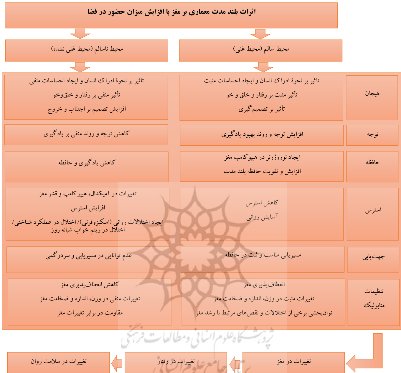
شکل ۳. اثرات بلندمدت فضای معماری بر فعالیت‌های مغز