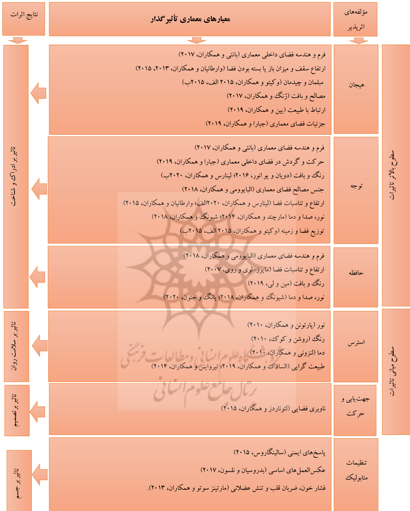
شکل ۲. اثرات کوتاه مدت فضای معماری بر فعالیت‌های مغز