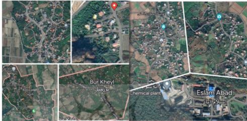
شکل ۲. محدوده مورد مطالعه در تقسیمات استان مازندران