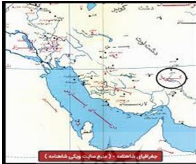
شکل ۲. نقشه موقعیت جغرافیایی محدوده مورد مطالعه

دارای رتبه اول می‌باشد. بارش سالانه در استان حدود ۱۱۰ میلی متر است. تنوع آب و هوایی بالا در استان کرمان باعث شده است که این استان دارای محصولات کشاورزی متنوع شامل محصولات گرمسیری و نیمه گرمسیری و درختان میوه مناطق سردسیری باشد.