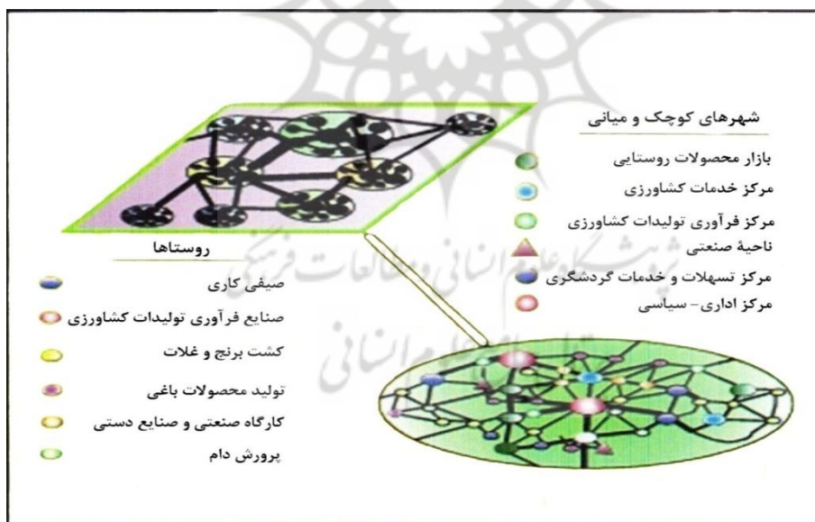
شکل ۱. الگوی نظری شبکه منطقه‌ای و پیوندهای روستایی - شهری

بدین ترتیب با مسئله‌شناسی از ساختار فضایی شهر و پیرامون و بویژه مدیریت حریم شهرها و ردیابی نظام اندیشه‌ای برای سازمان بخشی نظام سکونتگاهی در شهر و پیرامون و بویژه انتظام بخشی در نظام سکونتگاهی رویکرد سومی با عنوان رویکرد شبکه منطقه‌ای قابل توجه است. این رویکرد در چارچوب برنامه‌ریزی فضایی یکی از راهبردهای انتظام فضایی در راستای توسعه یکپارچه روستایی- شهری است که قاعداً بر این باور استوار است که حضور شهرها و روستاها در یک واحد توسعه منطقه‌ای، با تکیه بر پیوندهای روستایی- شهری، می‌تواند از یک سو، از تنوع فعالیت‌های (اجتماعی- اقتصادی) و توانمندی‌های مکمل موجود بین مراکز متنوع سکونت‌گاهی و از دیگر سو، از این فعالیت‌ها بین هر مرکز سکونت‌گاهی و حوزه نفوذ بلافصل آن بهره‌مند گردد. در این چارچوب، روابط بین مراکز سکونت‌گاهی بیش‌تر افقی، مکمل و دوسویه خواهد بود (سعیدی، ۱۳۹۲: ۲۰-۱۱).