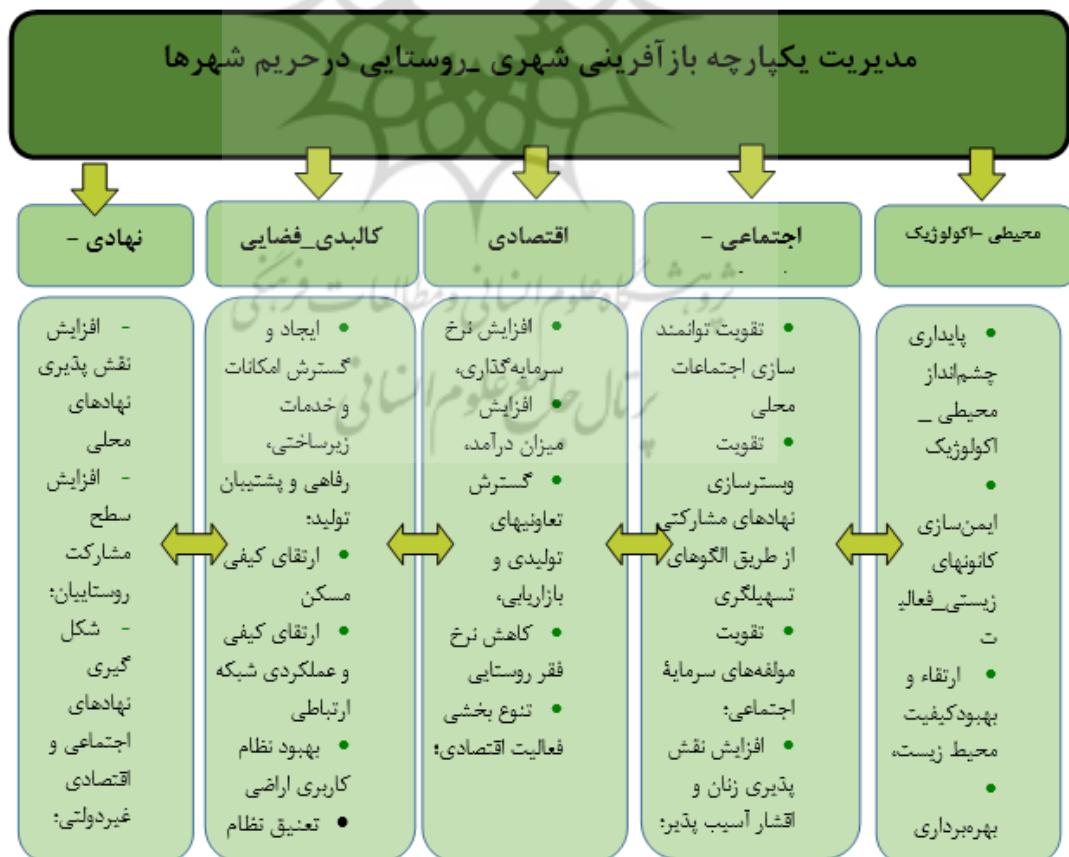
شکل ۴. سیاست کلان مدیریت روستاهای حریم شهرها مبتنی بر برنامه‌ریزی فضایی - راهبردی