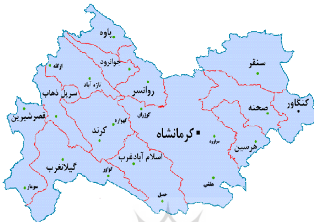
شکل ۱. نقشه استان کرمانشاه و محدوده‌های مکانی پژوهش