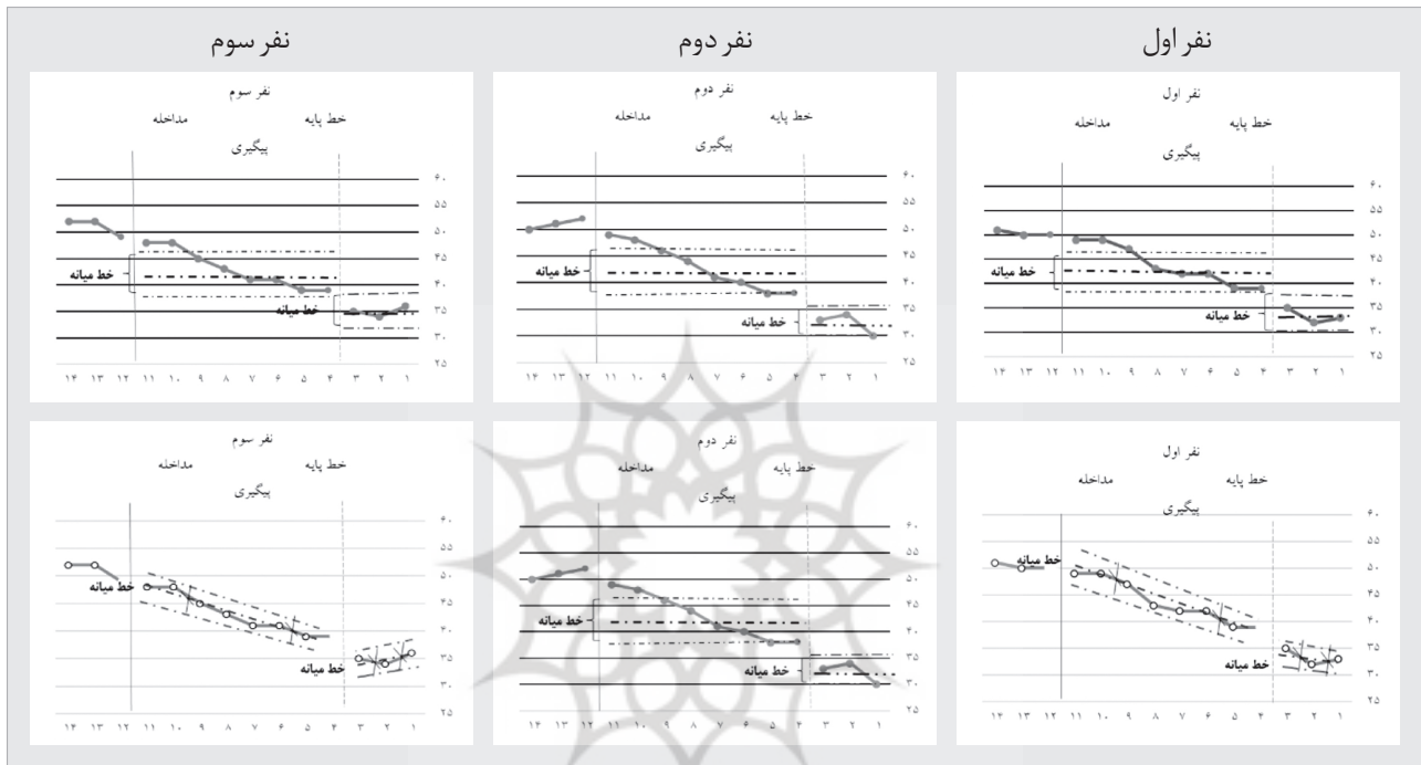
جدول ۷) بررسی شاخص‌های POD، PND، درصد بهبودی و اندازه اثر کلی تأثیر بازی درمانی مبتنی بر رابطه والد-کودک بر مهارت‌های اجتماعی