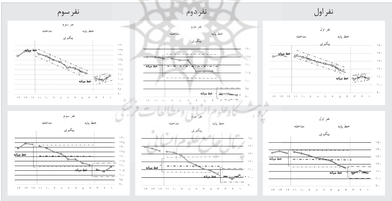
جدول ۶) بررسی شاخص های POD، PND، درصد بهبودی و اندازه اثر کلی تأثیر بازی درمانی مبتنی بر رابطه والد-کودک بر سازش یافتگی اجتماعی