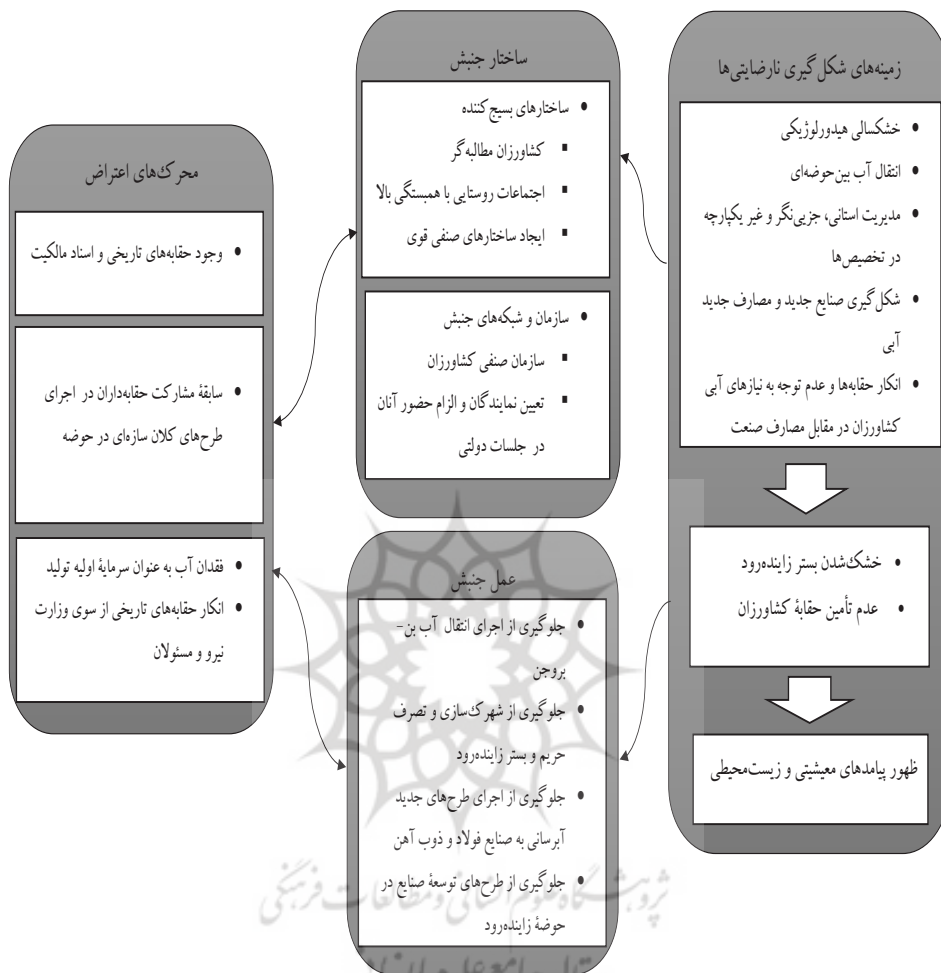
شکل شماره ۲: بازشناسی ساختار و عمل جنبش