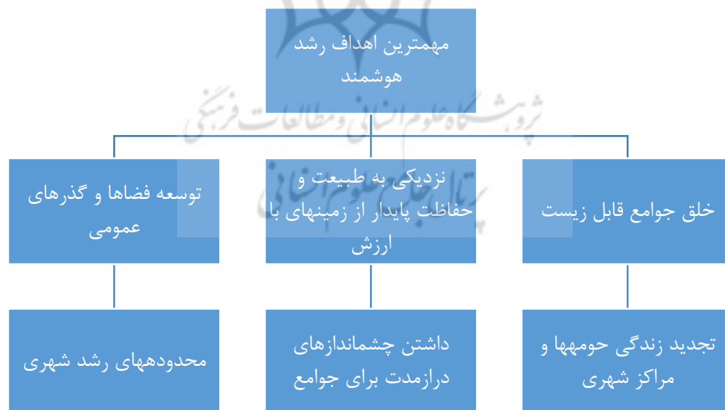
شکل (۱). مهم‌ترین اهداف شهر هوشمند (WWW.jhu.edu)