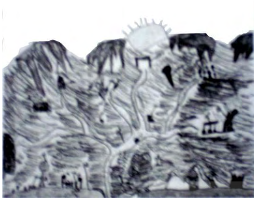
نقاشی یک کودک دبستانی سال چهارم از محله مسکونی مطلوب (Sutton et al, 2002)

بنابراین در صورت پدید آمدن شرایط مناسب، امکان پرورش خلاقیت در بسیاری از افراد فراهم می شود. در همین راستا می توان به دوران کودکی و نقش آن در پرورش خلاقیت نیز اشاره داشت، چرا که بدیهی است کودکی که در محیط نامساعد پرورش یافته از توان خلاقه کمتری برخوردار خواهد بود و عمده مشکلات افراد در زمینه خلاقیت ریشه در این دوران دارد. " [حسینی، ۱۳۷۶]