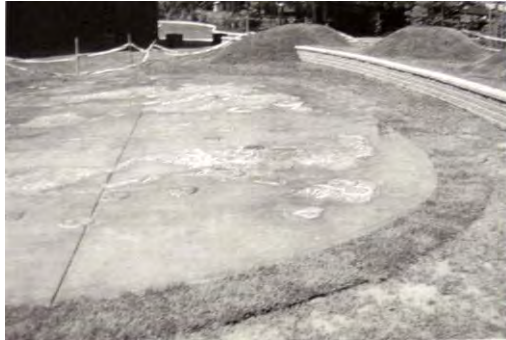
تصویر ۳. طرح مشارکتی کودکان با دانشجویان معماری برای نصب آثار هنری در حیاط دبستان (Sutton et al,2002)

یافتن به نیازهای واقعی کودک به عنوان استفاده کننده اصلی فضاست. در این خصوص با استناد به نظریات مشارکت استفاده کننده در فرایند طراحی، ورود کودکان به فرآیند طراحی و نظرسنجی از آنها به روش هایی چون نقاشی از محیط محله و تعامل مناسب آنان با کارگروه طراحی و ساخت و مداخله آنان در خلق فضای مناسب می تواند مورد توجه باشد. بدیهی است که مشارکت آگاهانه و علاقمندانه کودکان در خلق فضاهای باز محله مثل بوستان کودک، خلاقیت آنها را در تمام ابعاد برمی انگیزد و خود به ایجاد محیط خلاقانه تری منجر می شود و امکان حضور بیشتر و بهره برداری بهینه آنها را نیز به دنبال دارد.