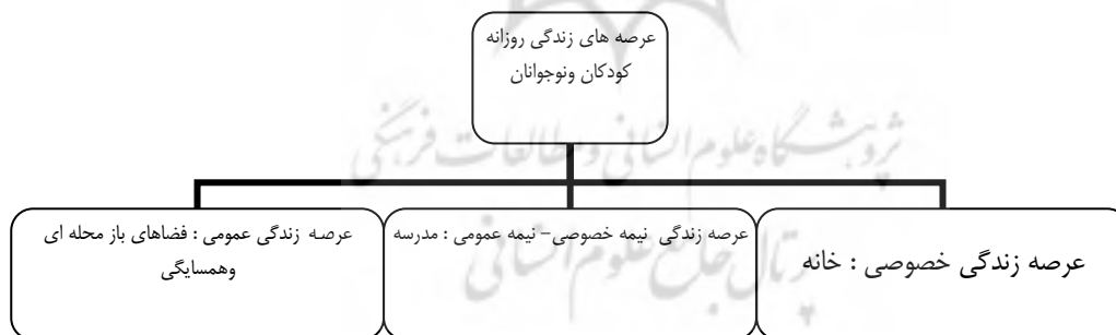
دیاگرام ۱- عرصه های زندگی روزانه کودکان و نوجوانان

علوم انسان سنجی، مهندسی عوامل انسانی و روانشناسی محیطی از زوایای کمی و کیفی به بررسی محدودیت ها و توانایی های فیزیکی و روانی انسان در ارتباط با محیط مصنوع توجه دارند و یافته های این رشته ها می تواند در شناخت ارتباط کودکان با محیط کمک کنند. جدیدترین نگرش مطرح در علوم یاد شده تأکید بر کل قرارگاه یا مکان رفتاری و نقش محیط انسان ساخت در ادراک رفتار استفاده کنندگان است [لنگ، ۱۳۸۱: ۱۴۲]. بنابراین با توجه به حضور مداوم خانواده ها و کودکان در مقیاس های مختلف محلی، لازم است این فضاها با نیازها و قابلیت های رشد جسمی و شناختی کودکان سازگاری داشته و ضمن جبران خلا ارتباط آنها با طبیعت - به ویژه- به شکوفایی توانایی های خلاقه آنها نیز کمک کنند.