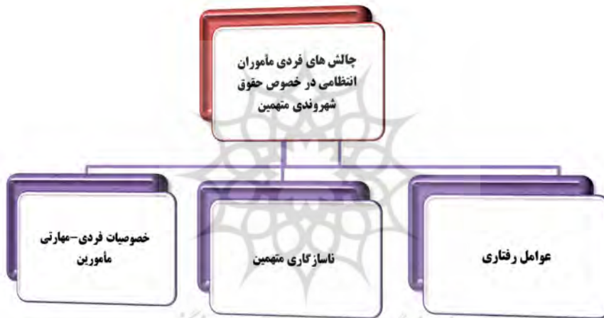
شکل شماره ۱: چالش‌های فردی کارکنان انتظامی مرتبط با حقوق شهروندی متهمین

ترتیب ذیل حاکی از آن است که در واقع با بهره‌گیری از ۳ دسته چالش عوامل رفتاری، ناسازگاری متهمین، خصوصیات فردی-مهارتی به هدف که همان شناسایی چالش‌های فردی مأموران انتظامی در خصوص حقوق شهروندی متهمین است؛ نائل شد.