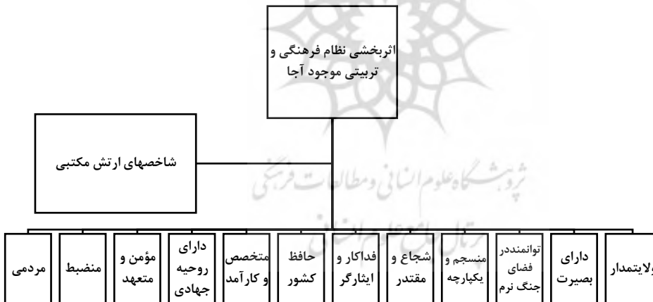
شکل ۱: شاخص‌های ارتش مکتبی

در جدول زیر متغیرها، شاخص‌های تحقیق و سطح سنجش آنها بیان شده است. پس از طراحی شاخص‌ها و مؤلفه‌های تشکیل دهنده ارتش مکتبی (مطابق شکل زیر) مستخرجه از بیانات و تدابیر مقام معظم رهبری و فرماندهی کل قوا (مدظله العالی) و نیز قانون اساسی و قانون ارتش جمهوری اسلامی ایران (مطابق شکل زیر)، هر یک از شاخص‌ها به وسیله سؤالاتی در قالب پرسشنامه محقق ساخته از نمونه آماری تحقیق مورد پرسش قرار گرفته و سپس با نرم افزارهای آماری موجود مورد تجزیه و تحلیل قرار گرفت.