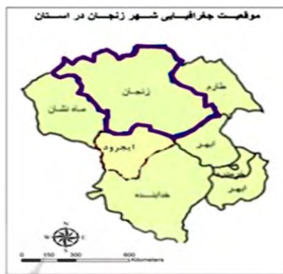
شکل ۱- موقعیت جغرافیایی استان زنجان در ایران و شهر زنجان در استان