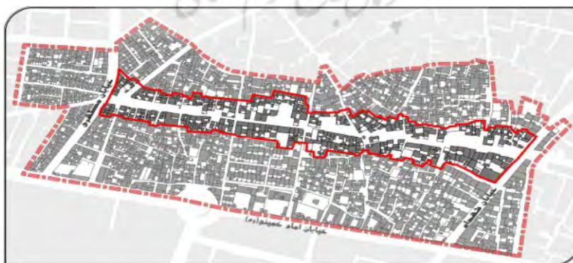
شکل ۴- محدوده‌ی مورد مطالعه