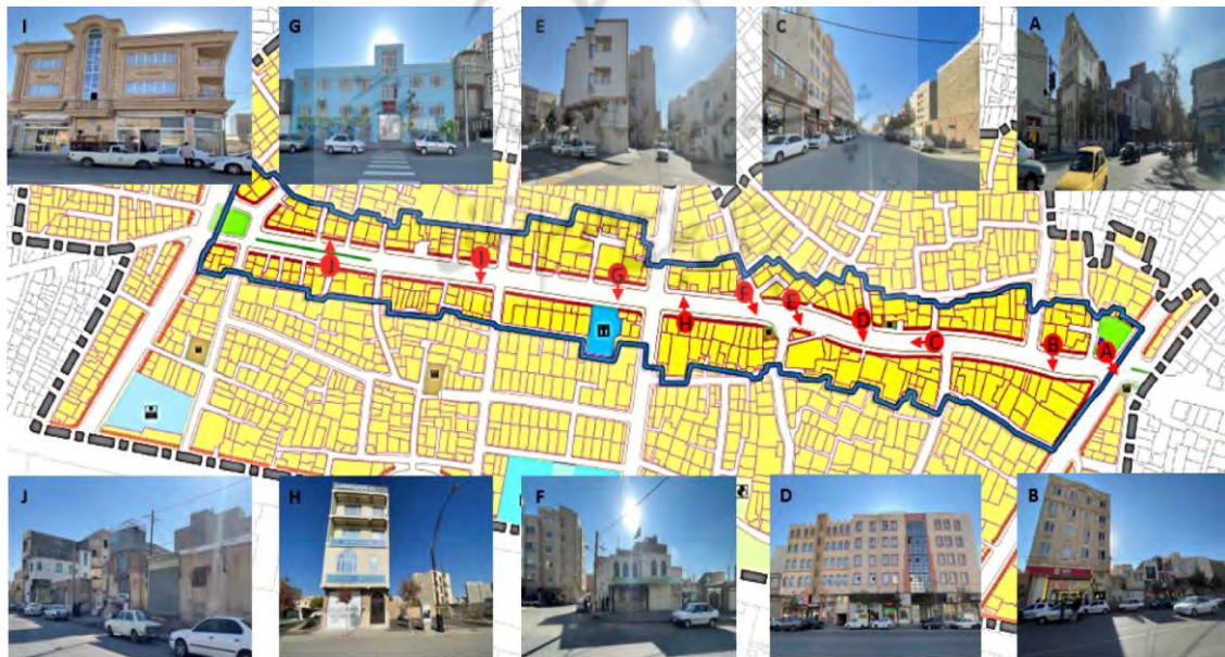
شکل ۵- دیدهای متوالی از محور مورد مطالعه

علاوه بر این خیابان‌های فرعی با سلسله‌مراتب پایین‌تر به‌صورت شمالی - جنوبی از این محور (شهید قامت بیات) انشعاب گرفته و دسترسی به مناطق درونی بافت و محلات را امکان‌پذیر نموده‌اند. همچنین در قسمت شمالی محدوده به دلیل وجود زمین‌های خالی فضایی برای پارک خودروها ایجاد شده که در برخی مواقع باعث اختلاط در تردد گردیده است. در بررسی عناصر شاخص موجود محدوده مورد مطالعه این