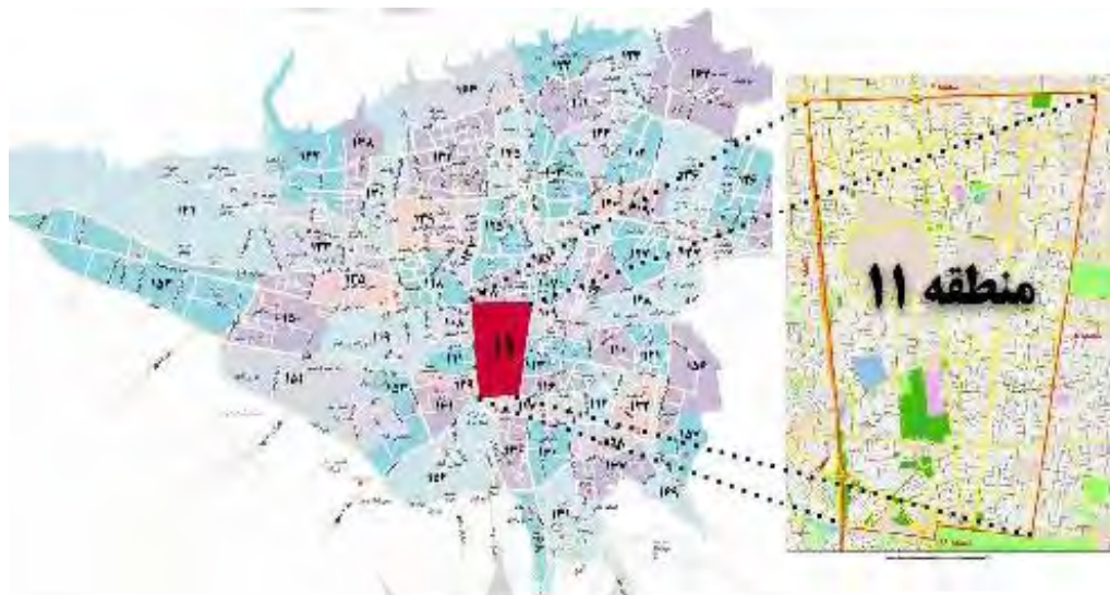
نقشه ۱- موقعیت منطقه ۱۱ در محدوده کلانشهر تهران