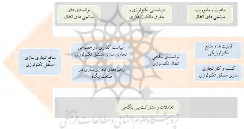
شکل ۳. مدل تجاری‌سازی مستقل تکنولوژی برگرفته از مدل پارادایمی

در ادامه، ضمن تشریح هر یک از مؤلفه‌ها در چارچوب مدل پارادایمی، پیشنهادهایی برای تسهیل فرایند تجاری‌سازی مستقل تکنولوژی خاص صنعت نفت و گاز ارائه شده است: