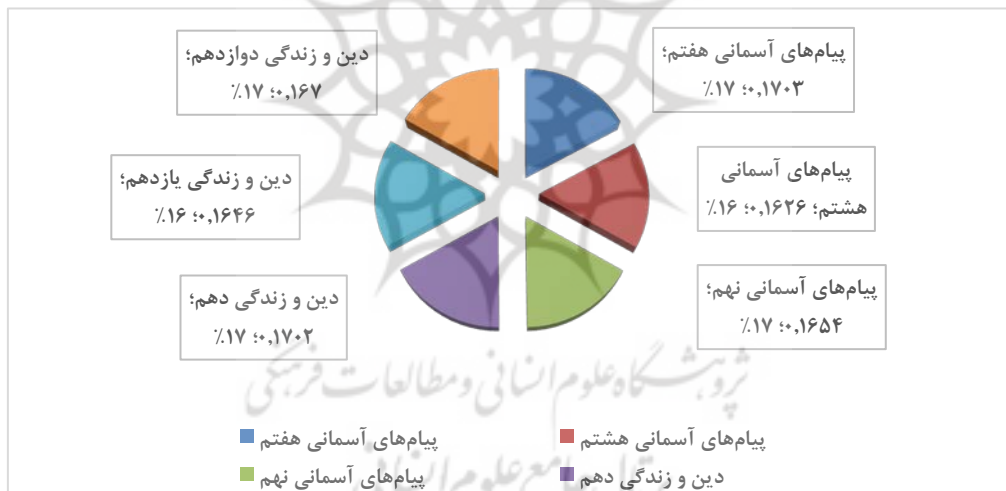
نمودار ۱: ضریب اهمیت کتاب‌های پیام‌های آسمانی و دین و زندگی در پرداختن به مؤلفه‌ها

نتایج جدول ۴ و نمودار ۱، نشان می‌دهد که بیش‌ترین ضریب اهمیت مؤلفه‌ها در کتاب پیام‌های آسمانی هفتم است و در مراتب بعدی به‌ترتیب: کتاب‌های دین و زندگی دهم، دین و زندگی دوازدهم، پیام‌های آسمانی نهم، دین و زندگی یازدهم و کم‌ترین ضریب اهمیت نیز در کتاب پیام‌های آسمانی هشتم است.