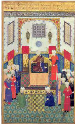
تصویر ۳: بازی شطرنج بوذرجمهر و سفیر هند، شاهنامه بایسنقری، قرن ۹ هجری.

استمرار بینش مزدایی و اصالت آن در تفکرات مانی نیز به چشم می خورد. مانی که به عنوان مصلحی عرفانی مدعی اصلاح و احیای ادیان پیش خود از خود آمد، نیز بنای تقابل نور و ظلمت نهاد، با این تفاوت که آفرینش این دو اصل را از هم جدا می داند و ظاهراً به ثنویت در آفرینش اعتقاد دارد که این جنبه از تفکر او با تعالیم اسلام و حکمت مزدایی مغایرت دارد. اما آنچه که بینش مانوی را در خور توجه قرار می دهد سنت تصویری غنی و تأثیر گذار آن، در تجسم نمادین نور و ظلمت و نیز انتقال این سنتهای تصویری غنی به دوره های متأخرتر است.