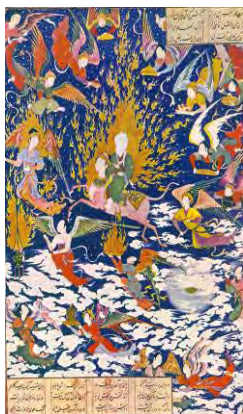
تصویر ۴: سلطان محمد، معراج پیامبر، خمسه شاه تهماسبی، مکتب تبریز، قرن ۱۰ هـ ق.