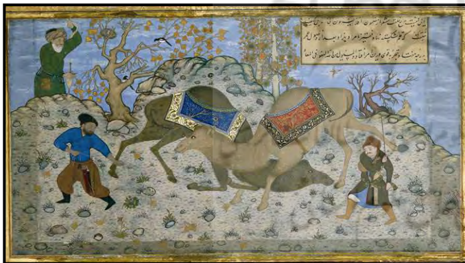
تصویر ۷ نزاع شتران، مرقع گلشن کمال الدین بهزاد. هرات، حدود ۹۳۵ هـ ق)