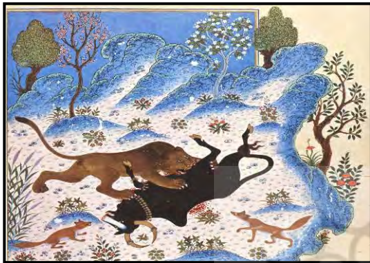
تصویر ۶ شیر در حال کشتن گاو، کلیله و دمنه شاهنامه بایسنقری، هرات، ۱۴۳۰

آورده اند. همچنین کیمیا وارد تصوف اسلامی شد و تا کنون نیز این تأثیر را در میان صوفیان دارد" [آرام ۱۳۶۶: ۴۷]. در واقع هنر نگارگری ایران در تجسم عالم ملکوت و ماهیت نورانی آن با استفاده از رنگهای ناب (ملهم از جوهره ی نورانی آنها)، و نیز، کاربرد طلا (با مفهوم کیمیایی آن) توانسته است، تصاویر نمادینی را بر مبنای مفاهیمی متعالی و معنایی خلق کند. نگارگر ایرانی توانسته است نور را بصورت تجسم آسمانهای طلایی که عالم سراسر نور خوارنه و حضور نور ایزدی را در جهان هستی نمایندگی می کند؛ هاله های نور طلایی رنگ دور سر قدیسن، پیامبران و شهریاران کیانی که نشان از برخورداری انسانهای کامل از خوره شهریاری یا "فر ایزدی" خاص آنها می دهد؛ تجسم گرفت و گیر نیروهای خیر و شر، نور و ظلمت در قالب داستانهای حماسی (مانند نبرد بهرام گور و اژدها) (تصویر ۵) و یا بیان سمبلیک آن در قالب فرم های حیوانی (مانند گرفت و گیر شیر و گاو) (تصویر ۶) و فرم های گیاهی (مانند درختان خشکی ده و سر سبز) (تصویر ۷) به صورتی محسوس وارد دنیای تصویری نمادین خویش نماید.