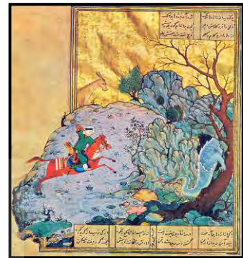
تصویر ۵ بهرام گور اژدها را میکشد، خمسه نظامی، کمال الدین بهزاد، هرات، حدود ۱۴۹۳، موزه بریتانیا، لندن.