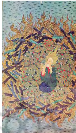
تصویر ۲: ابراهیم میان آتش مکتب شیراز، قرن ۸