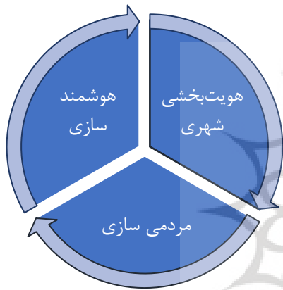
شکل ۱- تاکید بر ارکان سه گانه «هویت بخشی شهری»، «مردمی سازی» و «هوشمندسازی»

فرهنگی، صنایع دستی و گردشگری، وزارت راه و شهرسازی و غیره می‌باشد که هر روز به اهمیت آن افزوده می‌شود. تاکید بر ارکان سه گانه «هویت بخشی شهری»، «مردمی سازی» و «هوشمندسازی» در جهت حرکت به سمت چشم انداز تهران؛ کلانشهر الگوی جهان اسلام در حوزه رئیس سازمان زیباسازی شهر تهران، نقطه عطف مهمی محسوب می‌شود. در عمل، به منظور هویت بخشی به سیما و منظر شهر تهران، بخش مهمی از تجربه تحقق تحقق چشم انداز «تهران؛ کلانشهر الگوی جهان اسلام» و ابعاد مختلف آن است. (شکل ۱)