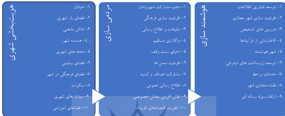
شکل ۴- اولویت های بهره گیری از ظرفیت های میراث معاصر تهران برای دست یابی به هویت اسلامی ایرانی شهر تهران در راستای تحقق چشم انداز «تهران؛ کلانشهر الگوی جهان اسلام» و ابعاد مختلف آن