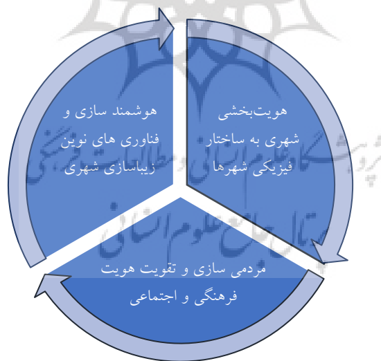
شکل ۵- تاکید بر ارکان سه گانه «هویت بخشی شهری»، «مردمی سازی» و «هوشمندسازی»