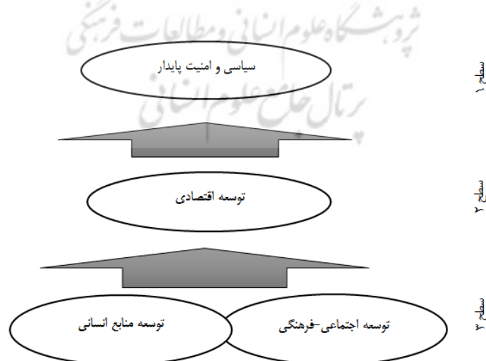
شکل ۲: سطح‌بندی عوامل اصلی با استفاده از مدل‌سازی ساختاری تفسیری

این سطح‌بندی در شکل ۳، قابل مشاهده است. نحوه سطح‌بندی عوامل بدین‌گونه است که هر عنصری که مجموعه دسترس‌پذیری