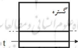
شکل ۲: پردازش نامتکامل (Langacker, 1987)