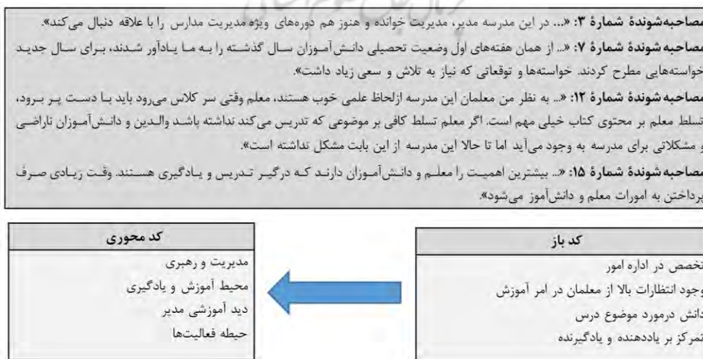
جدول ۱. نمونه‌ای از نحوه کدگذاری

به‌منظور پاسخگویی به این سؤال، ضمن مطالعه و بررسی کلی مصاحبه‌های انجام‌شده، مؤلفه‌های برندسازی مدارس احصا و به ابعاد و گویه‌های مختلفی تقسیم گردید. مزایای احصا شده در هر بعد، باید از یک نوع و یک جنس باشد، لذا لازم است مجموعه ابعاد تعریف‌شده، به‌صورت جامع و مانع دربرگیرنده همه مؤلفه‌ها باشد. بدین منظور در عمل فرایند کدگذاری ابتدا کل مصاحبه‌ها به‌دقت روخوانی شد تا معنا و مفاهیم اصلی در آن به‌صورت توصیفی شناسایی شود. نتیجه این مرحله یک تصویر کلی و توصیفی از هر مصاحبه بود. نمونه‌ای از داده‌های حاصل از مصاحبه و روند تحلیل آن‌ها در جدول ۱ آورده شده است: