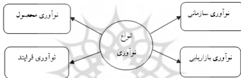
شکل ۲. الگوی نوآوری سازمان توسعه و همکاری اقتصادی (دستورالعمل اسلو، ۲۰۰۵).

طراحی محصول، بسته‌بندی محصول، موقعیت محصول در بازار، ترفیع محصول و قیمت‌گذاری محصول می‌شود. هدف نوآوری بازاریابی، شناسایی بهتر نیاز مشتریان، باز کردن بازارهای جدید یا موقعیت‌های جدید محصول شرکت در بازار با توجه به افزایش فروش شرکت است (کاتلر و آرمسترانگ ۱ ، ۱۹۹۱). مشخصه بارز نوآوری بازاریابی نسبت به سایر گونه‌های نوآوری، اجرای روش جدید بازاریابی است که شرکت تا به حال آن را اجرا نکرده است. طراحی محصولی که فقط ظاهر محصول را تغییر می‌دهد و مشخصات و کاربرد آن را تغییر نمی‌دهد نیز نوآوری بازاریابی محسوب می‌شود (دستورالعمل اسلو، ۲۰۰۵). لو و چن ۲ (۲۰۱۰) نوآوری سازمانی را مشتمل بر تغییرات در ساختار و فرایندهای یک سازمان در راستای به‌کارگیری مفاهیم جدید مدیریتی، کاری و عملیاتی مانند به‌کارگیری کارگروه‌های تخصصی در تولید، مدیریت زنجیره تأمین یا سیستم‌های مدیریت کیفیت در نظر گرفته‌اند (اسدپور و کارگر، ۱۳۹۴). نوآوری سازمانی شامل مسئولیت‌پذیری، پاسخگویی، ایجاد تغییر در تعداد سطوح سلسله‌مراتبی و جریان اطلاعات است (کراوس و همکاران ۳ ، ۲۰۱۲).