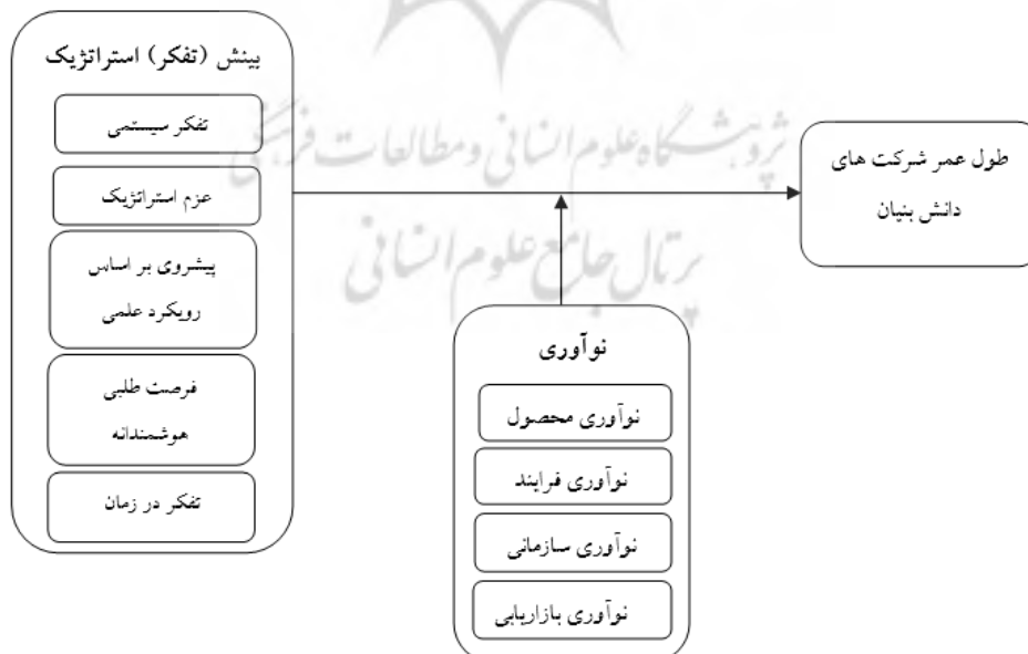
شکل ۳. مدل مفهومی پژوهش.

با توجه به مبانی نظری مطرح شده و موضوع پژوهش (تأثیر تفکر استراتژیک بر بقای شرکت‌های دانش‌بنیان) و نیز بررسی اثر متغیر تعدیل‌گر نوآوری، مدل مفهومی پژوهش مطابق با مدل تفکر استراتژیک لیدکا ۵ (۱۹۹۸) به نقل از غفاریان و کیانی (۱۳۸۹) و مدل نوآوری دستورالعمل اسلو (۲۰۰۵)، در شکل ۳ ترسیم شده است.