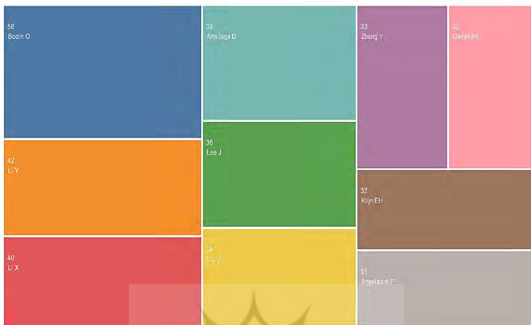
شکل ۳. مؤلفان دارای بیشترین تألیف در حوزه حکمرانی مشارکتی

مهم‌ترین نویسندگان پرتألیف در حوزه حکمرانی مشارکتی به اختصار در جدول ۳ معرفی شده‌اند.