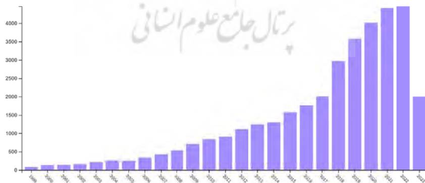
شکل ۱. تعداد کل اسناد منتشر شده تا جولای ۲۰۲۳

با استفاده از پروتکل جدول ۲، در جست‌وجو از سال ۱۹۹۹ تا جولای ۲۰۲۳ مجموع ۳۵۸۰۰ سند ۳ منتشر شده است که توزیع فراوانی آن‌ها در شکل ۱ نشان داده شده است.