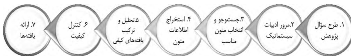
شکل ۱. گام‌های فراترکیب براساس روش هفت مرحله‌ای