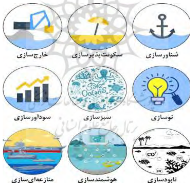
شکل ۲. کلان‌روندهای اقتصاد آبی

در نتیجه، ۶ کلان‌روند اصلی اقتصاد آبی، استخراج شد که در تصویر زیر ارائه شده است و در ادامه، توضیح کلی هر یک از این کلان‌روندها، ارائه خواهد شد.