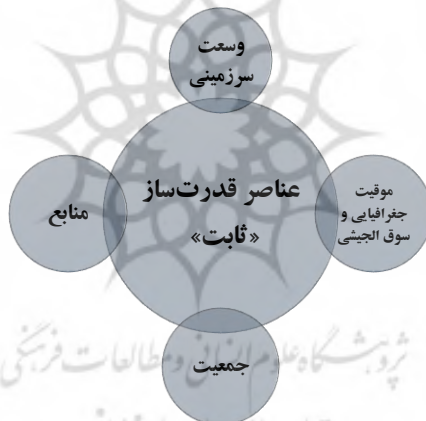
شکل ۱. عناصر قدرت‌ساز

اندیشمندان و صاحب‌نظران حوزه علوم سیاسی و روابط بین‌الملل همگی بر این عقیده متفق‌القول‌اند که همانا سیاست خارجی تداوم سیاست داخلی است. بر اساس این اصل غیرقابل‌انکار باید اذعان داشت که ارتباط، درهم تنیدگی و چسبندگی حوزه سیاست داخلی با سیاست خارجی از مهم‌ترین عرصه‌های تحول مفهومی در عرصه سیاست خارجی است. اگر در گذشته این امکان وجود داشت که بین مسائل سیاست داخلی و سیاست خارجی تفکیک و فاصله‌ای روشن را ترسیم نماییم اما امروزه این حد فاصل و انفکاک از بین رفته است و هر تصمیمی که در عرصه سیاست داخلی اتخاذ می‌گردد در محیط خارجی و بین‌المللی نیز تأثیرات مستقیم و آشکاری را از خود برجای می‌گذارد، همان‌گونه که تحولات خارجی نیز موجب تغییر و دگرگونی در سطوح ملی و سیاست‌های داخلی کشورها می‌گردند. به دیگر تعبیر، سیاست خارجی و دیپلماسی هر کشور به صورت مستقیم با عناصر و فاکتورهای تعیین‌کننده قدرت ملی آن کشور در ارتباط است. برخی از این عناصر همچون وسعت سرزمینی، موقعیت جغرافیایی و سوق‌الجیشی، منابع طبیعی و جمعیت به‌عنوان عناصر قدرت ساز «ثابت» مطرح‌اند.