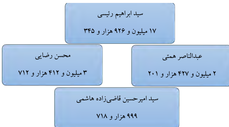
شکل ۵. نتایج انتخابات سال ۱۴۰۰