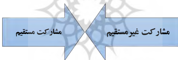
شکل ۳. تقسیم‌بندی مشارکت سیاسی

«قرارداد اجتماعی» مشارکت سیاسی به معنای درگیر شدن فرد در سطوح مختلف فعالیت در نظام سیاسی با اجتماعی شدن سیاست رابطه نزدیکی پیدا کرد (رایش، ۱۳۹۹: ۱۲۳)؛ (Reich, 2019: 123). اجتماعی شدن و مشارکت سیاسی در نظام سیاسی عصر نوین همراه با مدرنیته، لازم و ملزوم یکدیگر در امر حاکمیت و حکومت در دنیای نوین دانسته شده‌اند. در بین اندیشه‌های حاکم بر جامعه نوین، مشارکت سیاسی، دخالت هرچه بیشتر مردم و گروه‌های اجتماعی در مسائل سیاسی به صورت مستقیم یا غیرمستقیم دانسته می‌شود. مشارکت سیاسی در این معنا نوعی اختیار و آزادی عمل فردی است که به وسیله آن نوعی اعمال اراده و قدرت تصمیم‌گیری جمعی که مشروعیت حکومت را تضمین می‌کند، دیده می‌شود. کنار گذاشتن خشونت و نارضایتی و عمل کردن فرد بر اساس رفتارها و فراگردهای جمعی که نوعی برابری همگانی را می‌طلبد جدای از سیاست مربوط به دخالت شرکت‌ها و یا کلیسا در امور سیاسی مشارکت سیاسی نامیده می‌شود (واینر و هانتینگتون، ۱۳۹۹: ۱۴۱)؛ (Vainro, M. Huntington, 2019: 141). رابطه متقابل و انتظار از یکدیگر حوزه گسترده‌ای برای مشارکت سیاسی فراهم ساخته که عملکرد فرد در سازمان‌ها و نهادهای جامعه را در گستره مشارکت سیاسی نشان می‌دهد. مشارکت سیاسی دارای دو تقسیم‌بندی است: