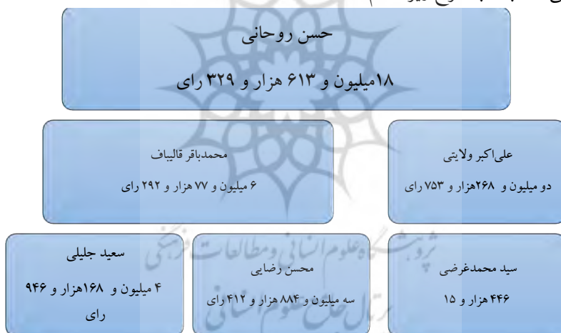
شکل ۴. نتایج انتخابات سال ۱۳۹۲

بر اساس آمار اعلام‌شده، در مجموع ۳۶ میلیون و ۷۰۴ هزار و ۱۵۶ نفر در انتخابات ریاست جمهوری یازدهم شرکت کردند که نشان‌دهنده حضور ۷۲٫۷ درصدی مردم در این انتخابات بوده است. از مجموع ۵۰ میلیون و ۴۸۳ هزار و ۱۹۲ نفر واجد شرایط رأی‌دادن، ۳۶ میلیون و ۷۰۴ هزار و ۱۵۶ نفر در انتخابات مشارکت کردند که حد نصاب ۷۲٫۷ درصد مشارکت را تشکیل دادند. نتیجه نهایی انتخابات به شرح زیر اعلام شد: