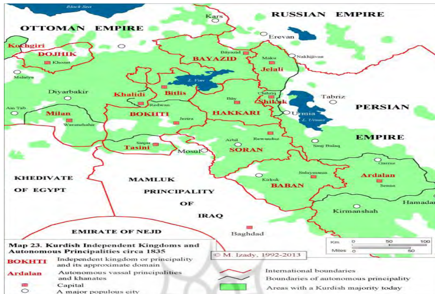
شکل ۱. تعداد و قلمروی امارت کردنشین