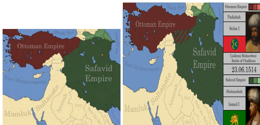
شکل ۴. مناطق کردنشین جداشده از صفویه و پیوسته به عثمانی

با این اوصاف، امارات مهم کُرد در شرق فرات مانند دیاربکر، بدلیس و حکاری به‌عنوان بخشی از قلمروی دولت عثمانی در دست و تسلط این دولت - البته با نوعی از خودمختاری محدود سیاسی و فرهنگی - قرار گرفت. اگرچه در آغاز پیروزی‌های عثمانی در مناطق کردنشین، سلطان سلیم و جانشینان او خدمات امرای کُرد را ستودند و حتی اختیار جانشینی امارات کُرد را به آن‌ها اعطا کردند، ولی به دلیل سازه‌های متعارض قومی، هویتی و مذهبی کُردها، نگرش اتحاد راهبردی کُردها و عثمانی با تنش‌های فراوان همراه شد؛ به طوری که امارت مهم دیاربکر به صورت شش حکومت و یازده سنجاق درآمد و متعاقب آن، تمامی امارت‌های کُردی به واحدهای کوچک‌تر تجزیه و در ذیل امپراتوری عثمانی قرار گرفت (اسکندر، ۱۳۸۰: ۸۴). سلطان سلیمان از کُردها سپری انسانی برای محافظت از مرزهای شرقی و مبارزه با صفویان ساخت (Kamal Mazhar, 1983: 40).