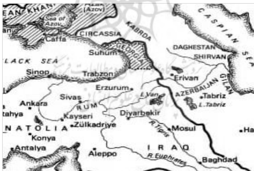
شکل ۳. قلمروی عثمانی بعد از نبرد چالدران