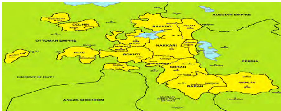
شکل ۵. امارت‌های کرد در کنش‌های درگیری صفویان و عثمانی