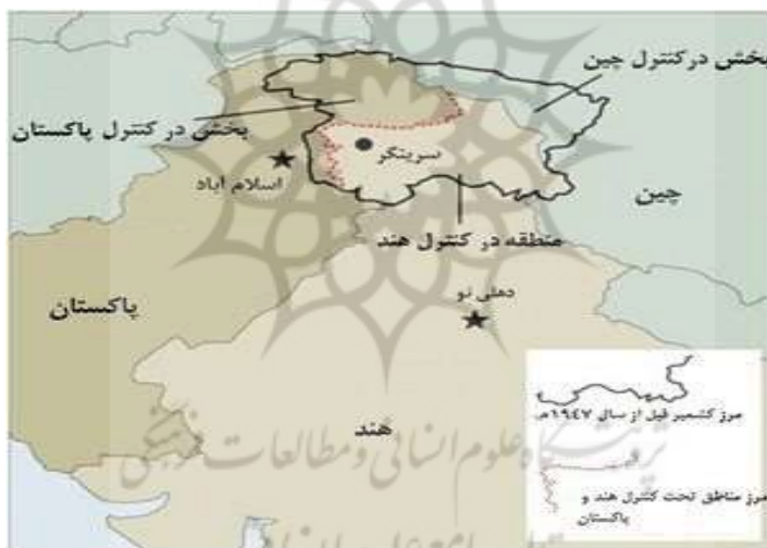
شکل ۱. موقعیت ژئوپلیتیکی کشمیر

پراکندگی جمعیت مذهبی در منطقه کشمیر بسیار متفاوت است. مسلمانان، هندوها، سیک‌ها و بودائی‌ها از جمله مهم‌ترین گروه‌های مذهبی در جامو و کشمیرند. از لحاظ پراکندگی، در جامو هندوها، در لداخ ۱ بودائی‌ها و در بقیه قسمت‌ها مانند گلگت، بلتستان، کشمیر و پونچ ۲ مسلمانان بیشترند. بنا بر گزارش‌ها، در قسمت کشمیر حدود ۹۴٪ مسلمان و بقیه عمدتاً هندو، سیک و بودائی‌اند؛ در جامو حدود ۳۰ درصد و در ایالت لداخ حدود ۴۶ درصد از جمعیت را مسلمانان تشکیل داده‌اند (در جامو ۶۶ درصد هندوها و در لداخ ۵۰ درصد جمعیت را بودائیان تشکیل داده‌اند). این در حالی است که در منطقه کشمیر تحت کنترل پاکستان تنوع مذهبی دیده نمی‌شود و در منطقه کشمیر آزاد با مرکزیت مظفرآباد ۱۰۰ درصد جمعیت را مسلمانان و در منطقه کلکت بلتستان نیز ۹۹ درصد جمعیت را مسلمانان تشکیل داده‌اند (دانشنامه جهان اسلام، بنیاد دایرة المعارف اسلامی، ۴۴۰۶) از آمار جمعیت مذهبی منطقه کشمیر تحت سلطه چین اطلاعاتی در دسترس نیست.