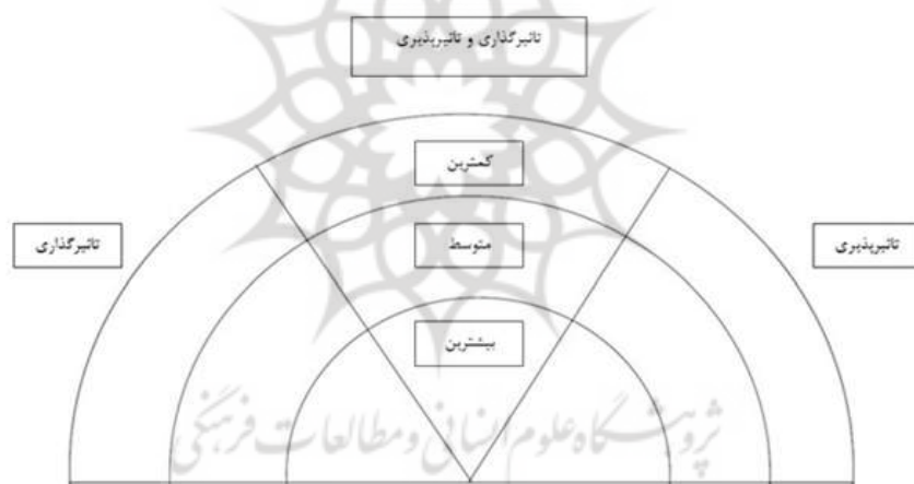
نمودار ۱. نمودار رنگین‌کمانی تحلیل بازیگر

بنابراین ذینفعان (بازیگران) در یک مسئله بر اساس سهمی که در پدیده تحت بررسی دارند، شناسایی می‌شوند. شناسایی بازیگران از طریق مواردی همچون شناسایی توسط کارشناسان؛ خودگزینی (در پاسخ به تبلیغات یا اطلاعیه‌ها)؛ از طریق سوابق مکتوب یا داده‌های موجود، از طریق کاربری‌های شفاهی یا مکتوب رویدادهای اصلی یا استفاده از فهرستی از دسته‌های بازیگران احتمالی انجام می‌گیرد. زمانی که بازیگران گروه‌بندی شدند با استفاده از تکنیک‌های مرتب‌سازی می‌توان آن‌ها را دسته‌بندی کرد (Chevalier And Buckles, 2008). چوالیر و باکلز (۲۰۰۸) جایگزینی بازیگران در نمودار رنگین کمان را پیشنهاد می‌کنند که بازیگران را طبق درجه‌ای که می‌توانند بر یک مسئله یا اقدام تأثیرگذار باشند یا تحت تأثیر قرار بگیرند، دسته‌بندی می‌کنند.