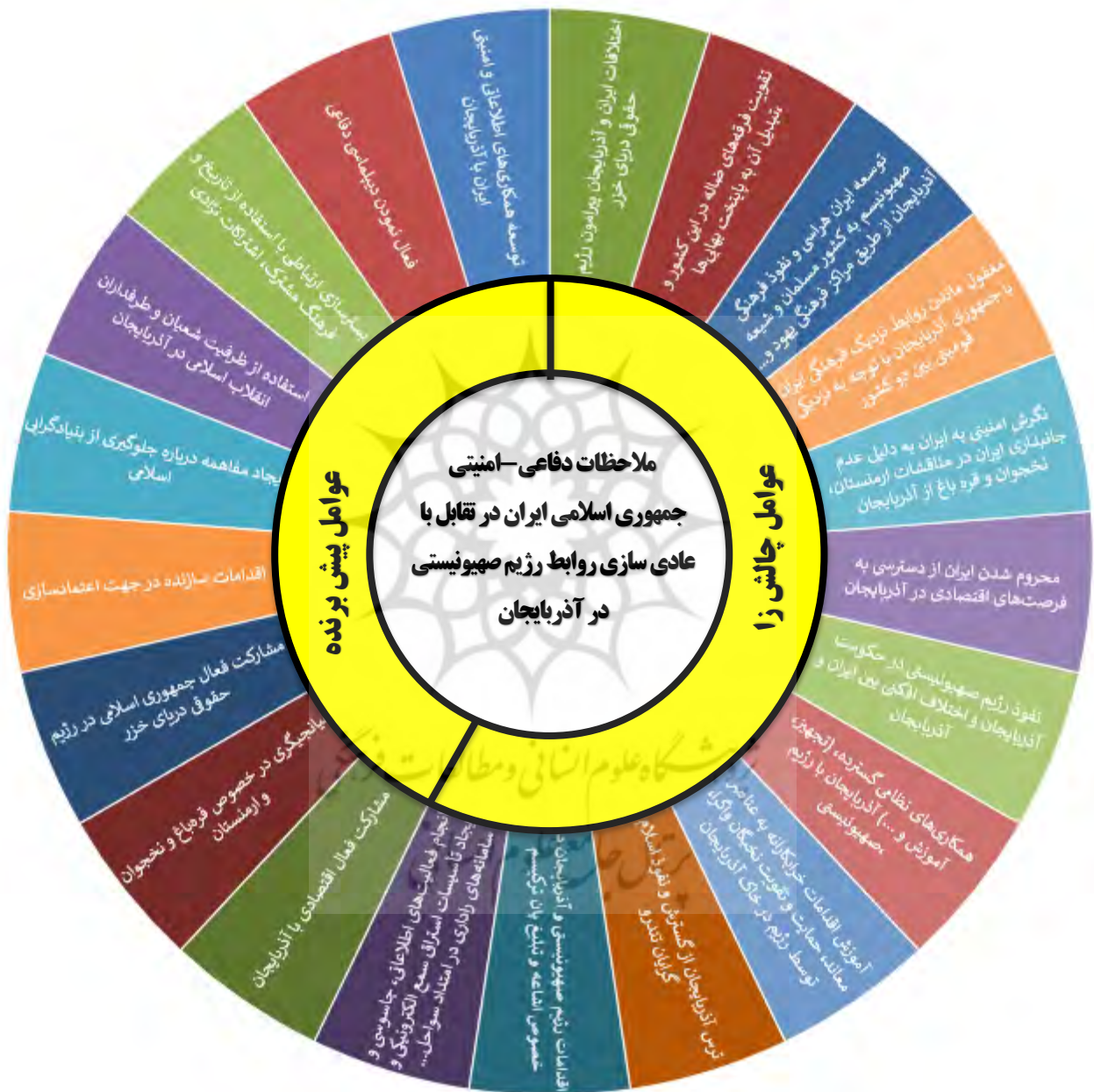
شکل ۲- مدل مفهومی تحقیق