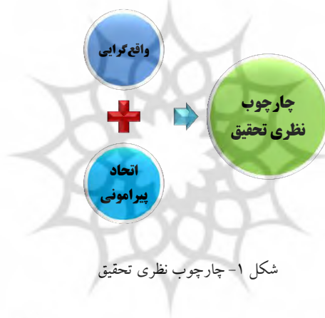
شکل ۱- چارچوب نظری تحقیق