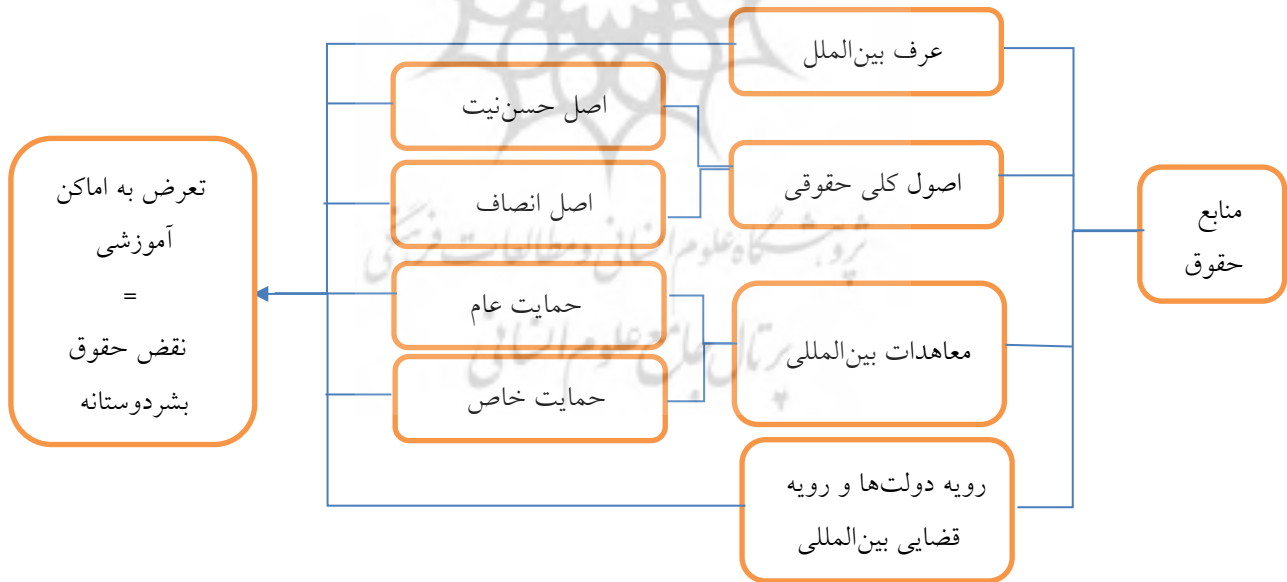
جدول ۱- مدل مفهومی مصونیت اماکن آموزشی به موجب حقوق بشردوستانه

بازیگران و نیز مقابله با دولت‌های متخلف، بر عهده می‌گیرند (صابری، ۱۳۷۸: ۱۵). از قواعد مهم در مخاصمه مسلحانه عدم حمله به اماکن غیرنظامی از جمله مکان‌های آموزشی است؛ بر این اساس و مطابق با ماده ۵۲ پروتکل یک اموال غیرنظامی به هر آنچه با هدف نظامی مورد استفاده قرار نمی‌گیرد، گفته می‌شود؛ بنابراین تجهیزات نظامی، مسیری که اهمیت استراتژیک دارد، ساختمانی غیرنظامی که تخلیه شده و توسط نظامیان اشغال می‌شود، اموال غیرنظامی نیستند؛ لکن در زمان تردید، اموالی که معمولاً برای استفاده‌های غیرنظامی اختصاص داده می‌شود، غیرنظامی است و نباید مورد حمله قرار گیرند که این موضوع هرگز مورد توجه عربستان و حامیانش در تهاجم به یمن قرار نگرفته و قرائن نشان‌دهنده نقض فاحش حقوق بین‌الملل در حمله به اماکن آموزشی با ادعای از بین بردن زیرساخت‌های جنبش انصارالله، است. ۱. از این رهگذر، ممنوعیت حمله به اماکن آموزشی را می‌توان در منابع حقوق جنگ به جستجو نشست. منابعی که بی‌ارتباط با منابع حقوق بین‌الملل نبوده و عرف، اصول کلی حقوقی، قراردادهای بین‌المللی و رویه قضایی دولت‌ها نقش مؤثری مطابق با مدل مفهومی ارائه شده ایفا می‌نمایند.