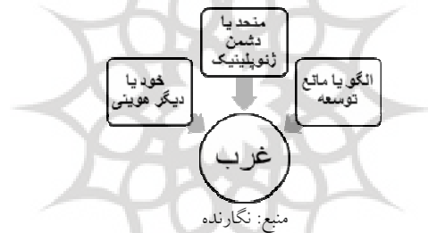
نمودار ۲. نقش غرب در مجادله‌ها

در دوره کنونی و به‌ویژه از ۲۰۱۴ و به‌طور مخاطره‌آمیزتری از ۲۰۲۲ روسیه به اوج تنش‌های خود با غرب رسیده که حتی امکان وقوع جنگ هسته‌ای نیز مطرح شده است. این موضوع موجب شده است تا نظریه‌های دولت‌گرا، ژئوپلیتیک و تمدنی، نظریه بین‌الملل‌گرایی را به حاشیه برانند. اگرچه خطوط تمایز سه نگرش یادشده بر سر رویارویی با غرب چندان روشن نیست و می‌توان از هم‌اکنون مهم‌ترین ویژگی هر یک را بر سر این وضعیت جدید در میزان رویارویی با غرب و نوع نگاه به شرق دانست. نظریه دولت‌گرا هم‌اکنون بر گزینه همکاری شرقی به‌عنوان یک واقعیت و یک گزینه ناگزیر می‌نگرد. در هر حال در نگرش ژئوپلیتیک بر تقابل بنیادین با غرب و جایگاه منحصر روسیه در اوراسیا و ضرورت احتیاط در تعاملات شرقی تأکید می‌شود. از سوئی، در نظریه تمدنی، رویارویی با غرب نه امری تهاجمی بلکه تنها ضرورتی دفاعی بوده و تعاملات شرقی نیز بایستی تا حد حفظ استقلال عمل مورد توجه قرار بگیرد. در نتیجه، مخاطره‌آمیزی روند قدرتمندی چین در به هم خوردن موازنه