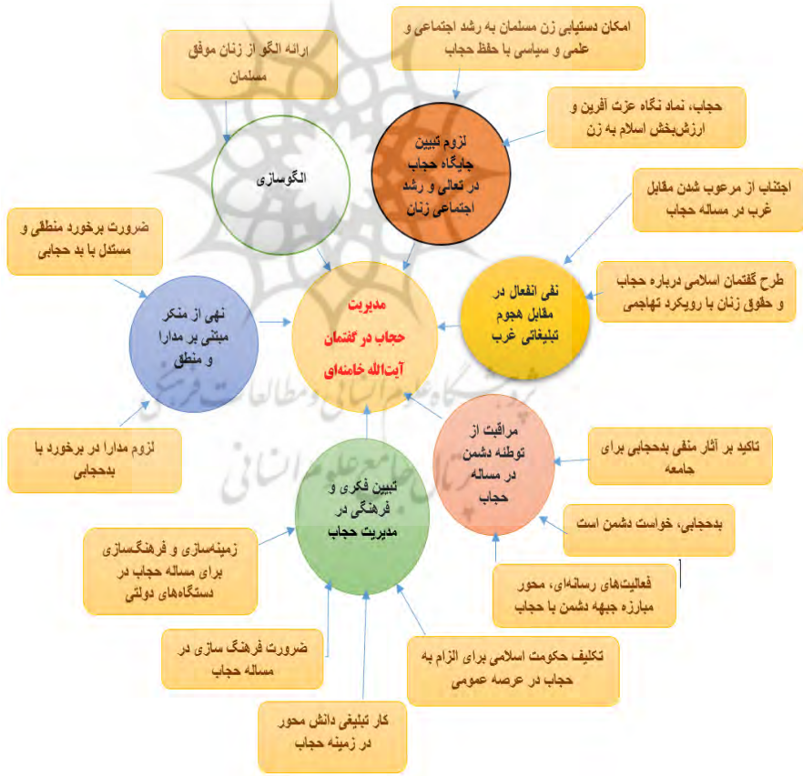
مدل شماره ۱: شبکه مضمونی گفتمان آیت‌الله خامنه‌ای درباره مدیریت حجاب

اصلی حکومت اسلامی»، «الگوسازی»، «نفی انفعال در مقابل هجوم تبلیغاتی غرب»، «نهی از منکر مبتنی بر مدارا و منطق»، «مراقبت از توطئه دشمن در مسأله حجاب» و «تبیین فکری و فرهنگی در مدیریت حجاب» مفصل‌بندی شده و یک برساخته معنایی را تولید کرده است. شناسایی این شاخص‌ها در منظومه گفتمانی آیت‌الله خامنه‌ای، نشانگر رویکرد ایشان به تثبیت نظام معنایی منطبق با الگوی فکری حکومت اسلامی، حفظ انسجام هویتی جامعه اسلامی، تداوم شاکله آرمان‌های انقلابی در حوزه فرهنگی به‌طور اعم و در مسأله حجاب به‌طور اخص و در نتیجه حفظ هژمونی ایدئولوژیک انقلاب اسلامی است. در ذیل، الگوی تصویری از تارنمای شبکه‌ای مضامین گفتمان آیت‌الله خامنه‌ای درباره مدیریت حجاب ترسیم شده است.