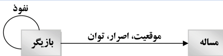
شکل ۱: اجزای تحلیل رفتار بازیگران در MACTOR

ماتریس‌های نفوذ (MDI) ۱ و اصرار (2MAO) ۲ در واقع دو ورودی نرم‌افزار MACTOR هستند و نرم‌افزار مبتنی بر این دو، کلیدی‌ترین بازیگران و موقعیت، توان، واگرایی و همگرایی بازیگران را ارزیابی می‌کند.