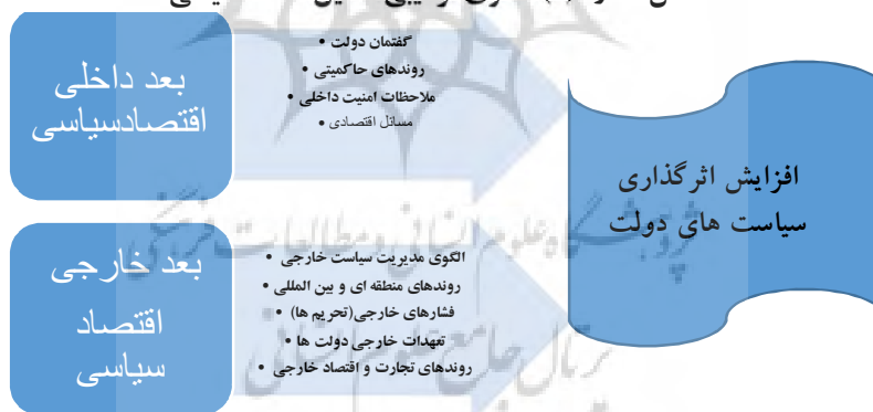
شکل شماره (۱): الگوی ترکیبی تحلیل اقتصاد سیاسی

الف. عوامل داخلی: فرهنگ سیاسی، نظام سیاسی، جمعیت، گسست‌های اجتماعی. ب. عوامل خارجی: روندهای منطقه‌ای، الگوهای رقابت-همکاری، اتحاد-دشمنی. در پژوهش حاضر الگویی ترکیبی مدنظر است؛ چراکه با تعریف ترکیبی مقاومت تناسب بیشتری دارد و توان بهتری برای تحلیل راهبرد مقاومت به ما می‌دهد. در این الگو، اقتصاد سیاسی در دو سطح داخلی و خارجی و با نه مؤلفه اساسی به شرح زیر تبیین و تحلیل می‌شود (نک: شکل شماره ۱).