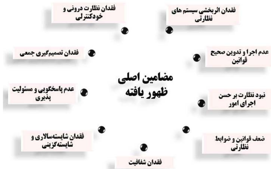
شکل (۲): شبکه مضامین اصلی پژوهش

طبق توضیح‌های ارائه شده هر یک از این مضامین و عوامل به‌صورت چرخ‌دنده‌هایی در نظام حکمرانی کشور در امر نظارت هستند. فقدان و نبود هر یک از این چرخ‌دنده‌ها باعث اختلال در عملکرد دیگر چرخ‌دنده‌ها می‌شود از این‌رو طبق توضیح‌های مذکور می‌توان نتیجه گرفت که عملکرد هر یک از این عوامل در گرو عملکرد دیگر عوامل شناسایی شده بوده که در کنار یکدیگر به مسئله نظارت در امر حکمرانی کشور ساختاری مناسب می‌بخشد.