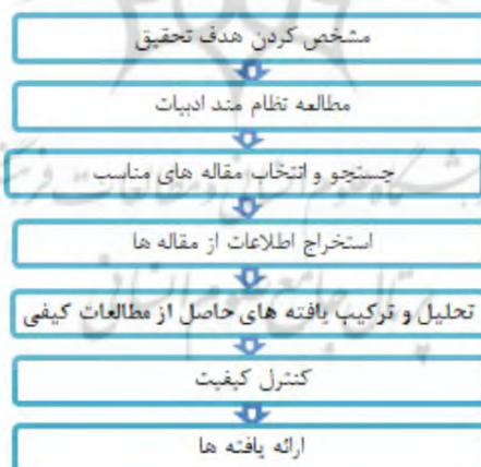
شکل ۱- مراحل روش فراترکیب (سندلوسکی و باروسو، ۲۰۰۷)

در گام اول اجرای تحقیق با روش فراترکیب، نیاز است تا هدف اصلی پژوهش آشکار گردد