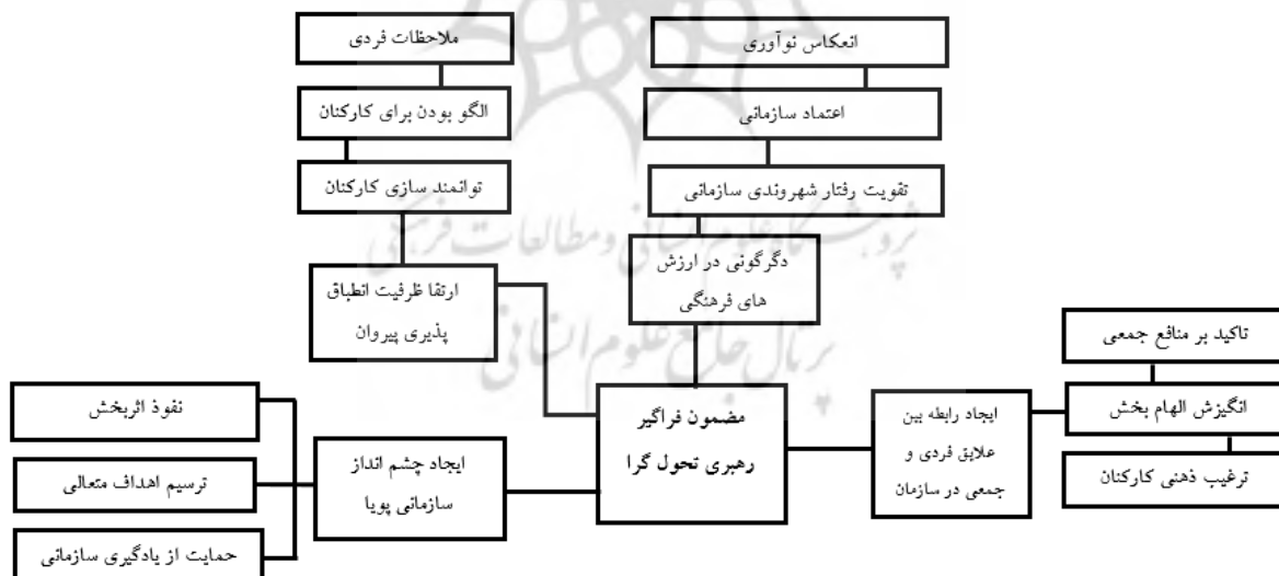
شکل ۱- شبکه نهایی مضمین رهبری تحول‌گرا

در نهایت پس از طی مراحل اختصاص کدهای اولیه به پاره‌گفتارهای مشارکت‌کنندگان، اختصاص کدهای اولیه به پاره‌گفتارهای استخراج شده، ادغام کدهای اولیه و استخراج مضمین پایه، دسته‌بندی مضمین پایه به مضمین سازمان‌دهنده، دسته‌بندی مضمین سازمان‌دهنده به مضمون فراگیر و تدوین نهایی مضمین و ارائه بازخورد به مشارکت‌کنندگان، بازبینی و موضع‌گیری پژوهشگر، شبکه نهایی مضمین استخراج و در شکل (۱) آورده شده است؛ نتایج نشان داد مفاهیم استخراج‌شده مربوط به متغیر رهبری تحول‌گرا شامل ۳۱ کد اولیه، ۱۲ مضمون پایه و ۴ مضمون سازمان‌دهنده می‌باشد که تشکیل‌دهنده متغیر رهبری تحول‌گرا هستند.