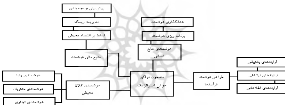
شکل ۳- شبکه نهایی مضامین هوش استراتژیک

در نهایت پس از طی مراحل اختصاص کدهای اولیه به پاره‌گفتارهای مشارکت‌کنندگان، اختصاص کدهای اولیه به پاره‌گفتارهای استخراج شده، ادغام کدهای اولیه و استخراج مضامین پایه، دسته‌بندی مضامین پایه به مضامین سازمان‌دهنده، دسته‌بندی مضامین سازمان‌دهنده به مضمون فراگیر و تدوین نهایی مضامین و ارائه بازخورد به مشارکت‌کنندگان، بازبینی و موضع‌گیری پژوهشگر، شبکه نهایی مضامین استخراج و در شکل (۳) آورده شده است؛ نتایج نشان داد مفاهیم استخراج شده مربوط به متغیر هوش استراتژیک شامل ۳۲ کد اولیه، ۱۱ مضمون پایه و ۴ مضمون سازمان‌دهنده می‌باشد که تشکیل‌دهنده متغیر هوش استراتژیک هستند.