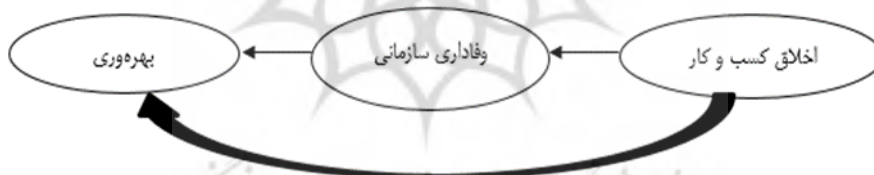
شکل ۱- مدل فرضی پژوهش