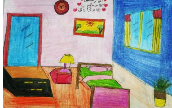
تصویر ۱. فضای اتاق خواب