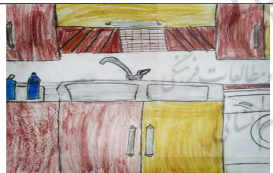
تصویر ۶. فضای آشپزخانه