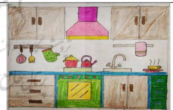
تصویر ۵. فضای آشپزخانه