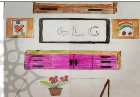
تصویر ۳. فضای پذیرایی