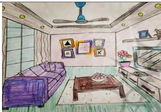
تصویر ۴. فضای پذیرایی