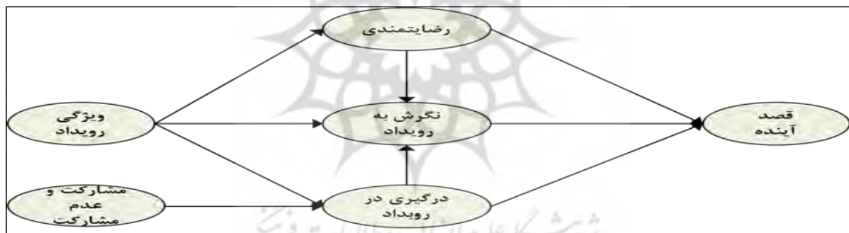
شکل ۱. مدل مفهومی عوامل موثر بر مشارکت در رویدادهای ورزشی آفلاین