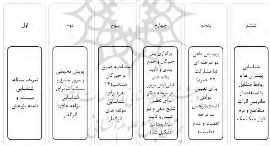
شکل ۱- چارچوب و گام‌های روش پژوهش

در شکل شماره یک، خلاصه‌ای از فرآیند اجرایی پژوهش مشاهده می‌شود.