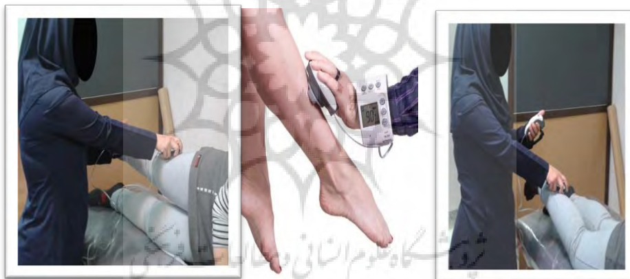
۳- نحوه اندازه‌گیری قدرت با دینامومتر

از دستگاه دینامومتر پایی برای اندازه‌گیری قدرت ایزومتریک عضلات اندام تحتانی استفاده شد. قبل از اجرای آزمون، محقق نحوه اجرا را توضیح داد. برای هر آزمون، دو بار اندازه‌گیری انجام شد. قدرت عضلات دورکننده و نزدیک‌کننده ران، همسترینگ، چهارسررانی و سرینی اندازه‌گیری شد و میانگین آن‌ها در پیش‌آزمون-پس‌آزمون گزارش شد.