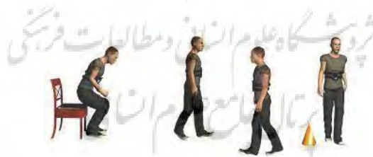
شکل ۲- شیوه اجرای آزمون زمان‌دار نشستن و برخاستن

از آزمون دسترسی عملکردی برای اندازه‌گیری تعادل ایستا استفاده شد. نحوه اجرای آزمون به این صورت است که شرکت‌کننده در محل ازپیش تعیین‌شده در مجاورت یک متر کاغذی که روی دیوار نصب شده است، از سمت برتر خود می‌ایستد. او با بازکردن پاها به اندازه عرض شانه، به طوری که بدنش با دیوار زاویه ۹۰ درجه ایجاد کند، کنار دیوار می‌ایستد. بازوی کنار دیوار را ۹۰ درجه بالا می‌آورد (دست در حالت مشت شده است) و به وسیله درجه‌بندی براساس سانتی‌متر اندازه‌گیری می‌شود. سپس از شرکت‌کننده خواسته می‌شود بدون اینکه قدمی بردارد و تعادلش به هم بخورد، تا آنجاکه می‌تواند به جلو خم شود. بعد از رسیدن به حداکثر جابه‌جایی ممکن، دوباره مقداری که فرد خم شده است، اندازه‌گیری می‌شود. تفاوت اندازه‌گیری‌های اول و دوم به واحد سانتی‌متر ثبت می‌شود (شکل شماره یک). (۱۸)